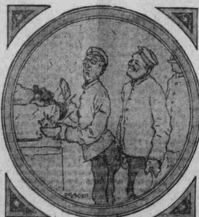
Beim Essensessen: „Danke, danke vielmals. Ich bin kein harter Esser.“