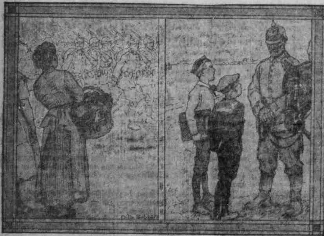
Die Kritik: „Aur, det so viele een' Lanting haben, ist schade!“