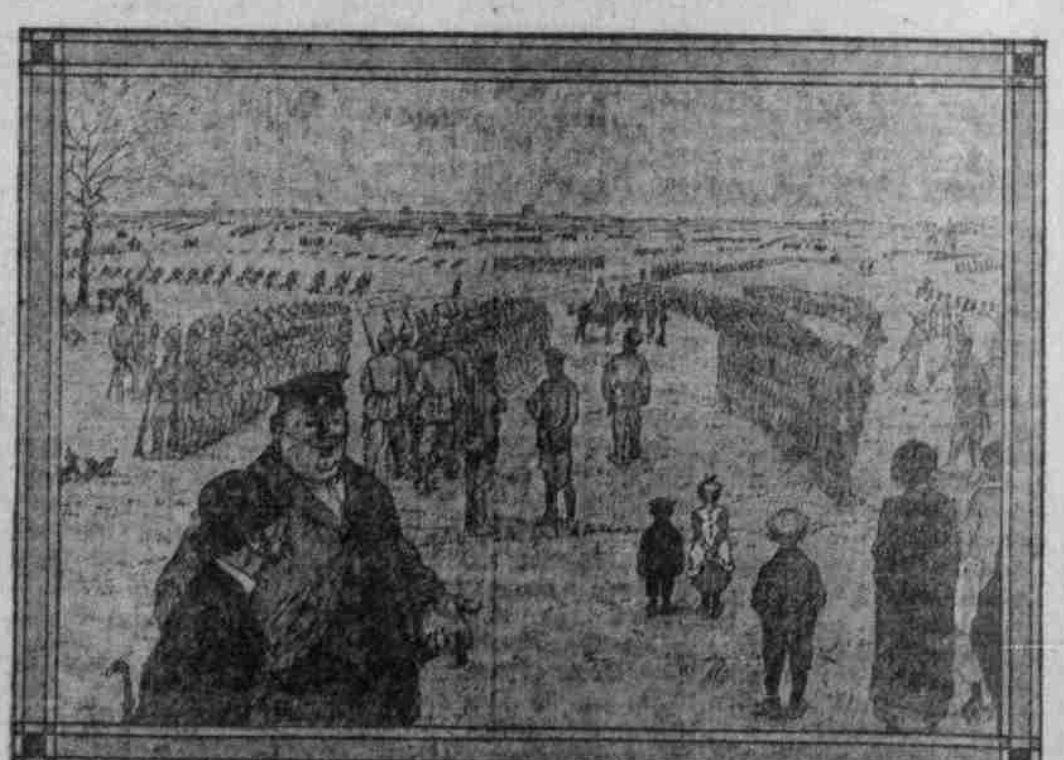
Der Dünne: „Nun, sind Sie noch nicht dran?“ — Der Dicke: „Nein, mir nehm' se erst, wenn se uffs Tempelhofer Feld wieder Platz kriegen.“

Neue Briefmarken. In unserer so bewegten Zeit sind Kriegsmarken keine Ueberflüssigkeit mehr, und doch hat Österreich soeben erneut eine Serie Marken herausgegeben, die ebenfalls diesen Namen verdienen. Die Briefmarkensammlung hat viele neue Anhänger zu gewinnen. Die neue österreichische Reihe