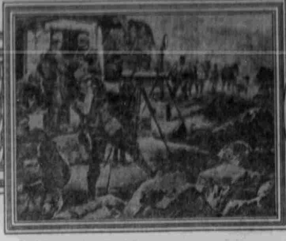
Ein Stützpunkt der österreichisch-ungarischen Truppen drohtes die Bewegungen italienischer Vorposten.