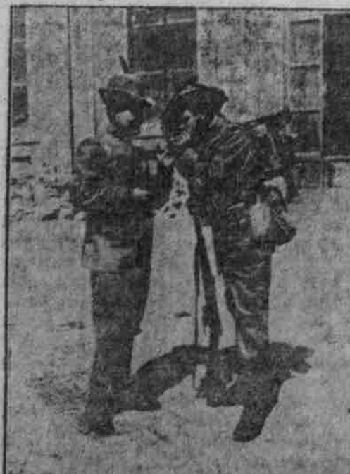
B. J. O. Bersaglieren und Jäger in feldgrauer Uniform