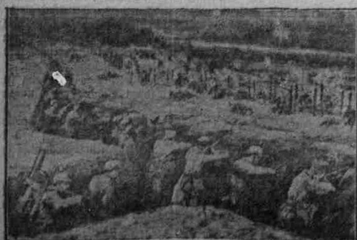
Ein Sturmangriff der Franzosen bei St. Michel bricht an den deutschen Stellungen zusammen.

von 5 Marken zu 8, 5, 10, 20 und 35 Heller zeigt in der Reihenfolge Infanterie im Schützengraben, eine Kavalleriepatrouille, einen 30,5-Zim.-Motormörser in Feuerstellung, das Großkampfschiff „Viribus unitis“ und einen Aetoplan. Rothviolett, grün, karminrot, schieferblau und ultramarin wechseln himmelstreu ab.