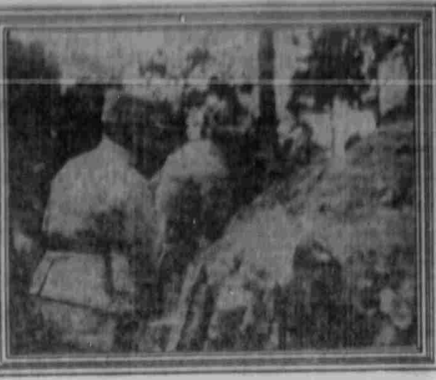
Gen. Canli hohlet von verdeckten Gräben aus die Zirkung des Gegners.