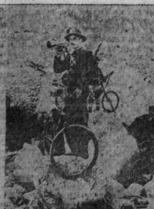
B. J. O. Bergjägerpatrouille in den Alpen