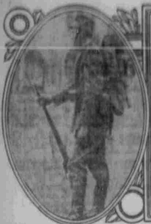
Die italienische Uniform: Ein Soldat.