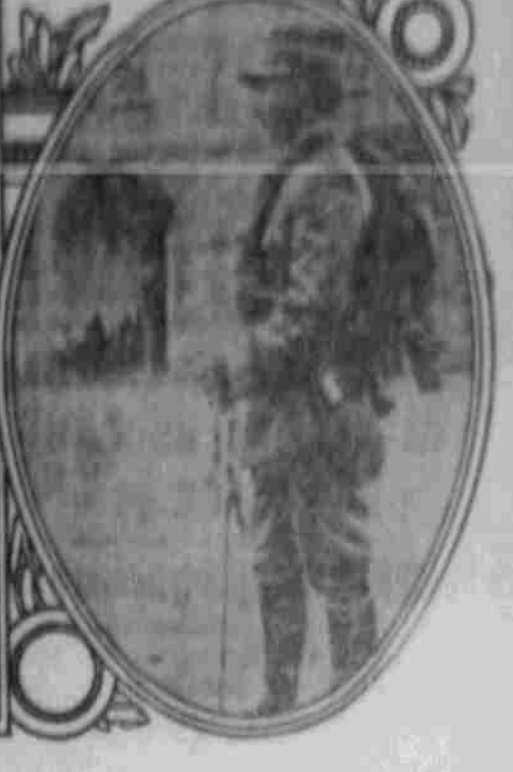
Die italienische Uniform: Ein Offizier.