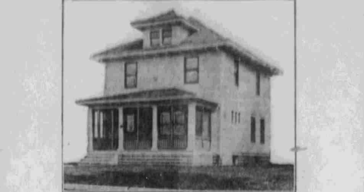
Perpektiv-Ansicht — nach einer Photographie.

Das Eigenheim Winke für seine Konstruktion und Einrichtung