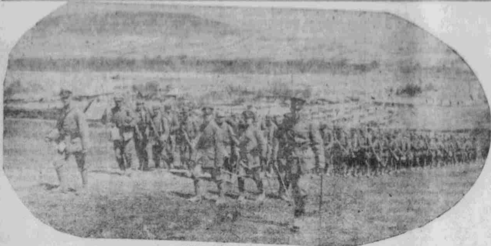
Auf dem Marsch im Luboregatal.