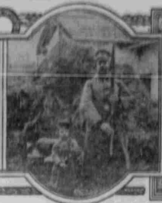
Zur Kampagne, Herr Baron ist und seinen Mutter nach Preussisch kam.