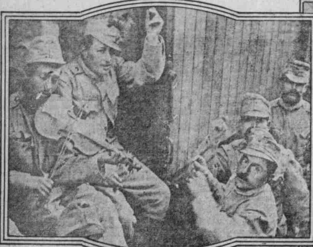
Landsturmänner älterer Jahrgänge während des Transports zur Front.