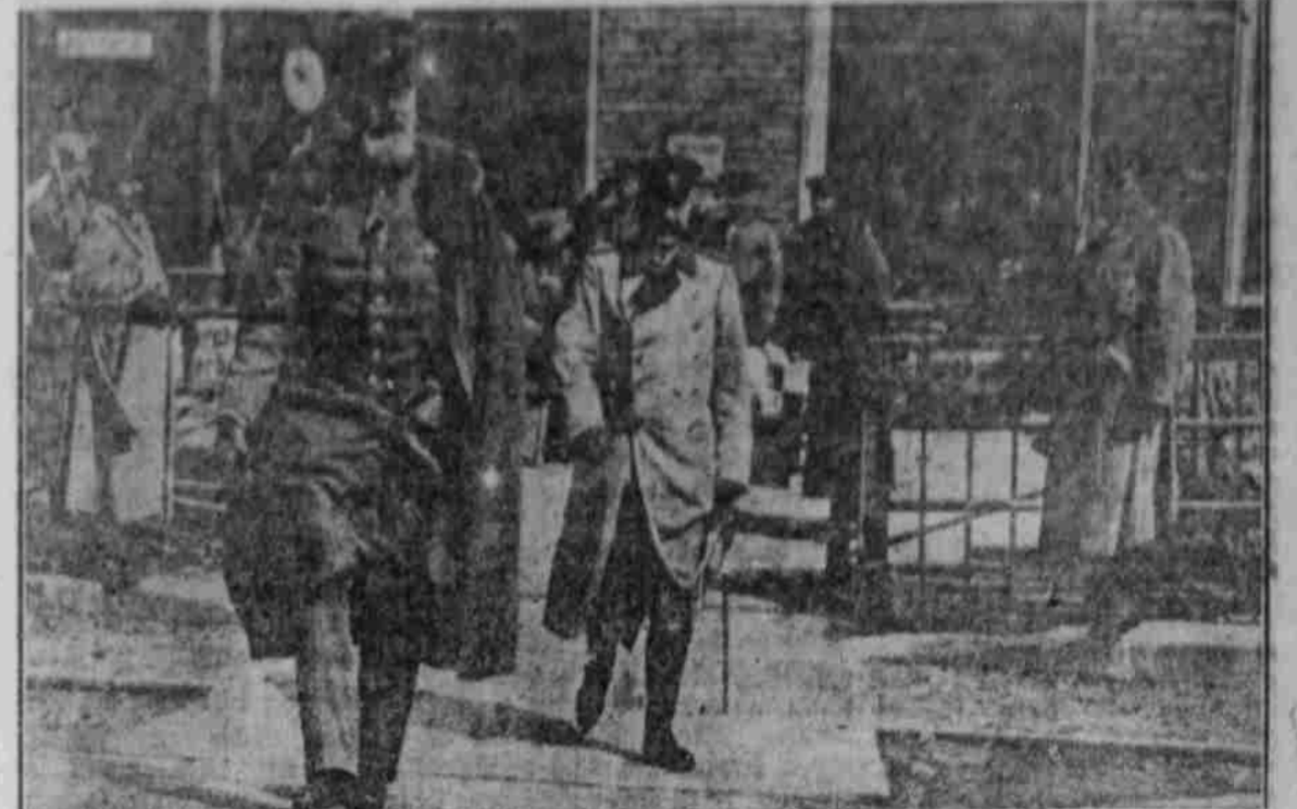
Prinz Leopold von Bayern, der Bruder König Ludwigs, wollte vor kurzem auf dem östlichen Kriegsschauplatz, befehligt in Begleitung des Feldmarschalls von Hindenburg verschiedene Wehrstellungen der russischen Grenze.