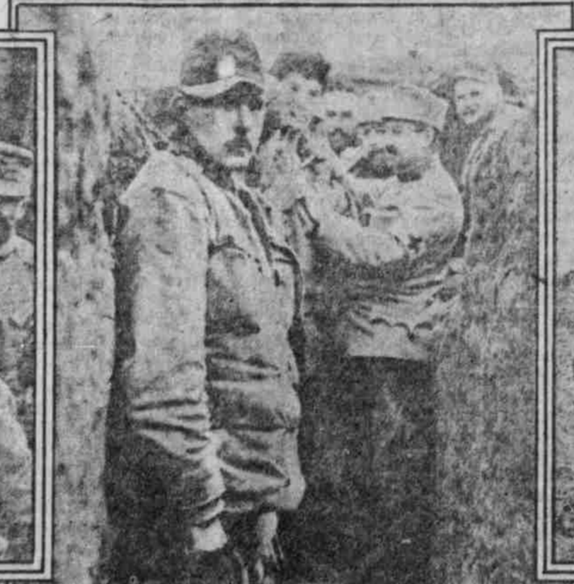
Impfung von Soldaten im Schützengraben.