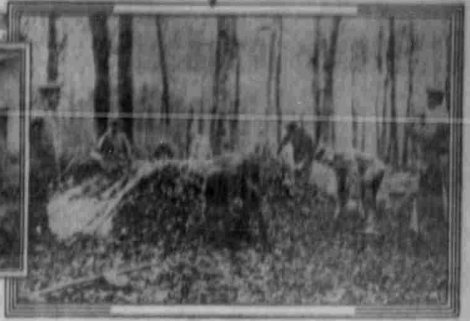
Der Holz als Helfer im Kriege. Erhebung von Holzbohlen in einem Wald von Nord-Preussisch.