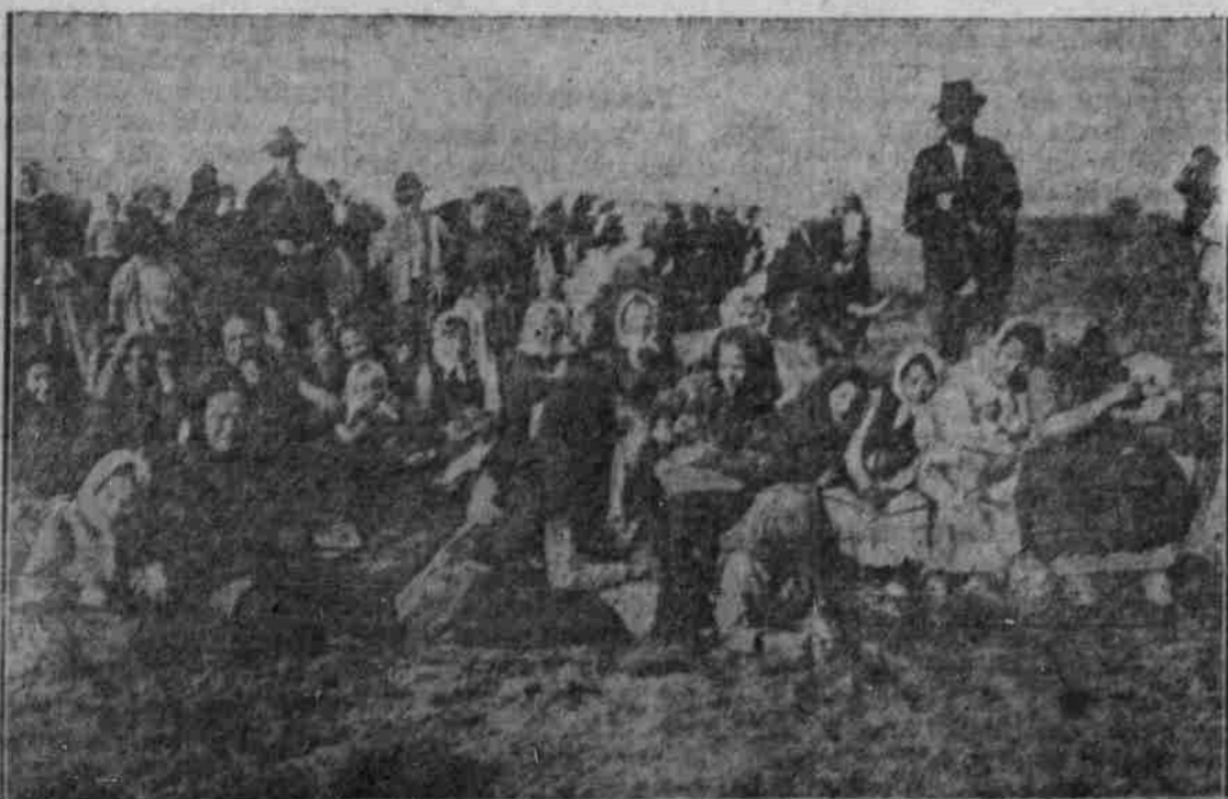
Flüchtlinge aus den Karpathenbüchern im Luboregatal.