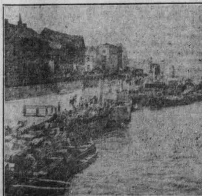
Einschiffung der Truppen in Zilist.