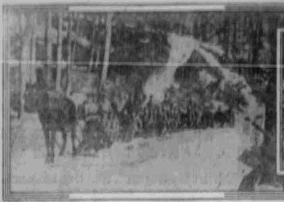
Verwendungsfürer in Zöbelen. Rohleistung erbsenbedürftiger Holzbohlen in Kainers.