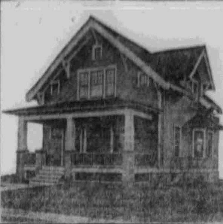
Perspektiv-Ansicht — nach einer Photographie.