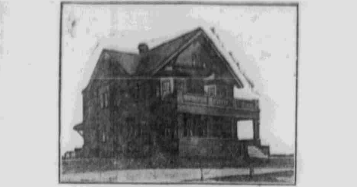
Perspektiv-Ansicht — nach einer Photographie.