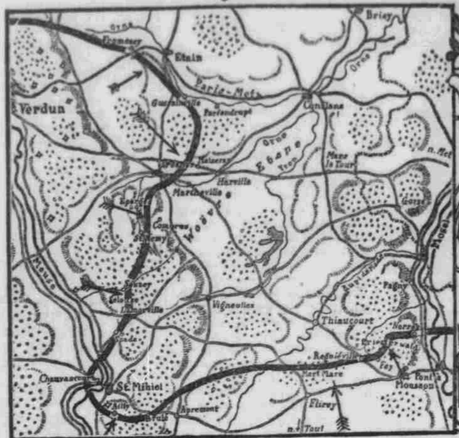
ZWISCHEN MAAS UND MOSEL.