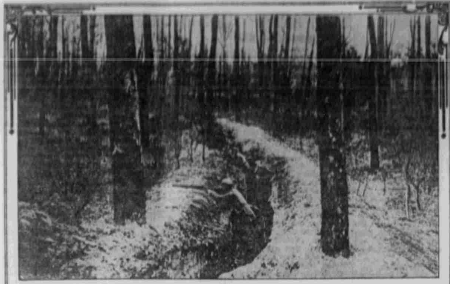
Auf der Wacht im Schützengraben