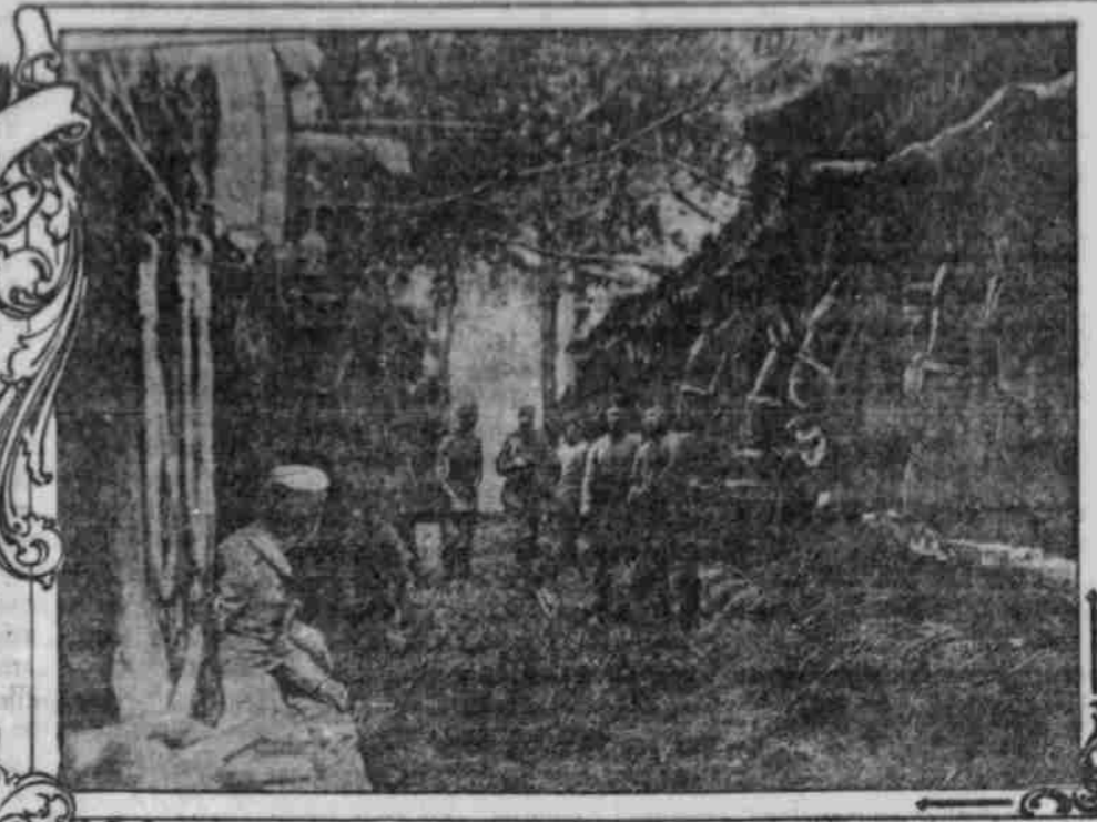
UNTERSTAND für PERDE bei St. MIHIEL