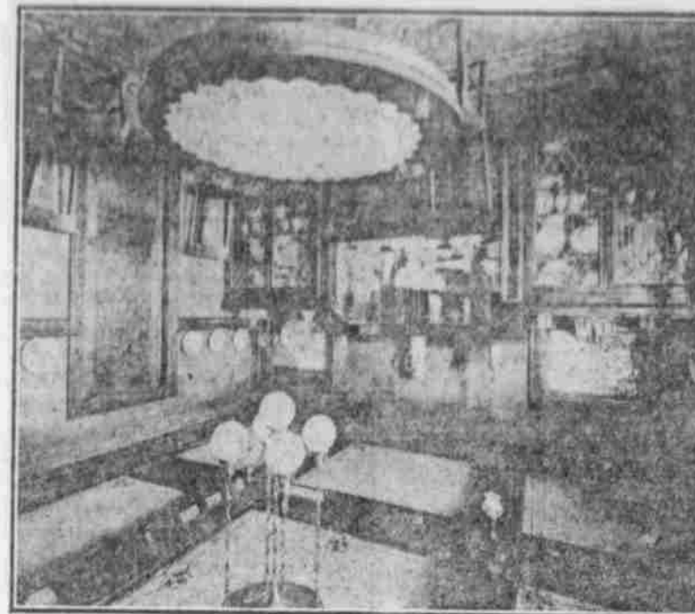
Innere Ansicht — Speisezimmer.

Die innere Ansicht dieses Entwurfs zeigt ein Speisezimmer von ungewöhnlicher Anziehungskraft. Die Porzellanrückwand und das Buffet nehmen eine ganze Seite des Raumes ein, auf diese Weise genügend Raum für die Aufstellung von Porzellan und Schliffglas bietend. Baukosten $5,200.