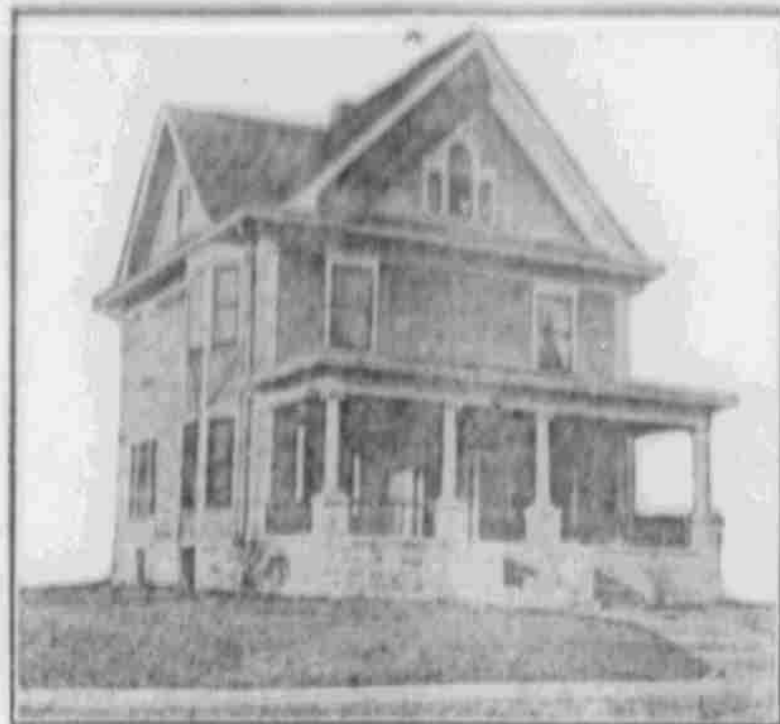
Perpektiv-Ansicht — nach einer Photographie.