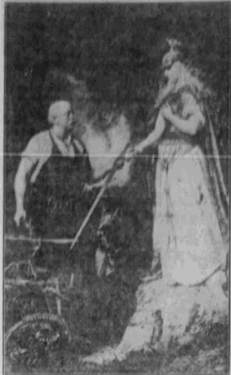
Der Schmied der deutschen Einheit (nach einem Gemälde von Guido Schmitt).

Unterthanen Schuler ertheilt werden, und eines einer Frau Jung, beide in Deutschland verbleiben. Diese Entscheidung wurde im Einklange der Öffentlichkeit getroffen werden, da die deutsche Regierung überläßt bei französischen Unterthanen zu verbleiben zwecks Befreiungsgeld und Jochhaltung der darin befindlichen Geiseln.