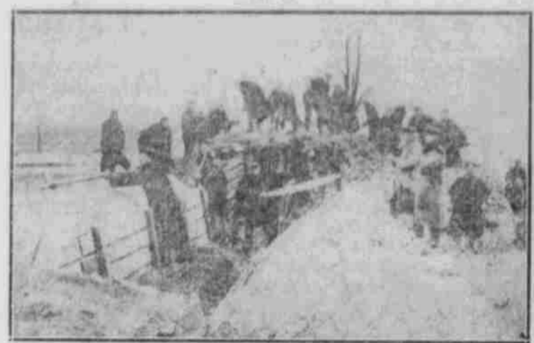
Die Kunst der deutschen Pioniere: Herstellen eines wohnlichen und gemüthlichen Unterlandes für unsere tapferen Soldaten.