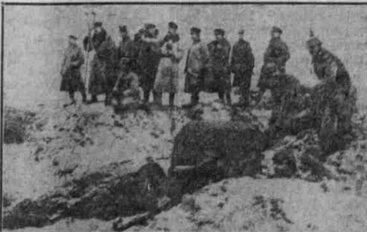
Stabs-Offiziere auf einem Hügel bei einer Artillerieabtheilung zwischen Mawa und Bierpe. Das Geschütz ist den Russen entziffen worden.