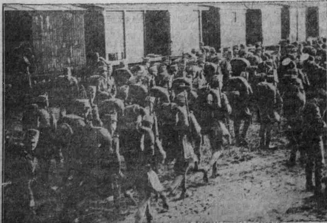
Ungarisch-ungarischer Infanterie auf dem Südbahnhof in Wien zur Abfahrt nach dem Kriegsschauplatz.