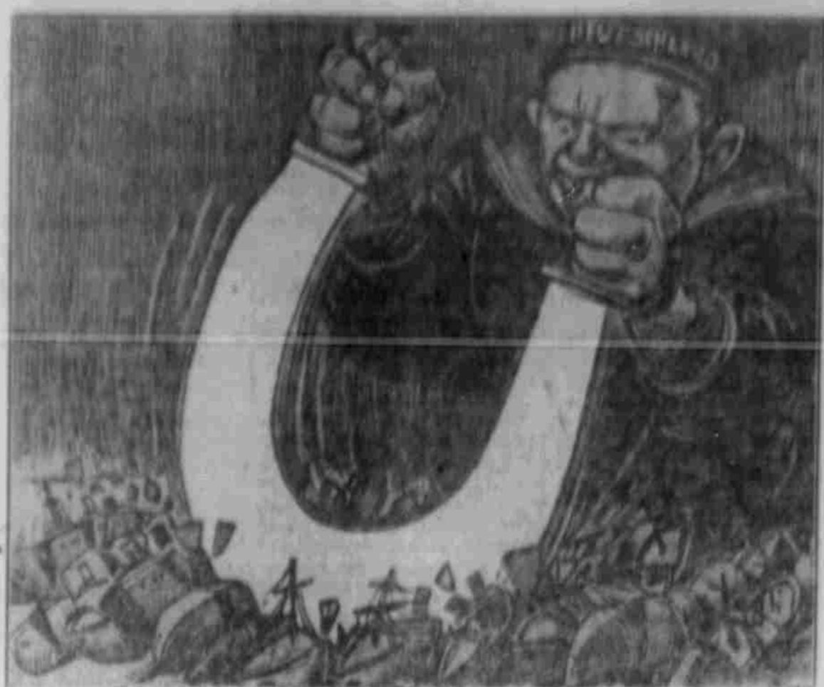
Das große Schwert.

„Stimmung“ im Krieg gefallen, v. H. 6 Richter, 202 Verwaltungs- und Verwaltungsbeamte, Richter, Staatsanwälte, 205 Rechtsanwält, 203 Advokaten, 400 Referendare und so weiter.