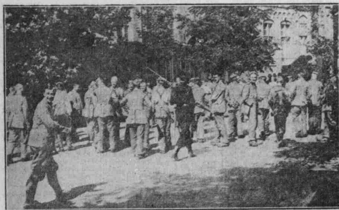
Pioniere in Brücke.