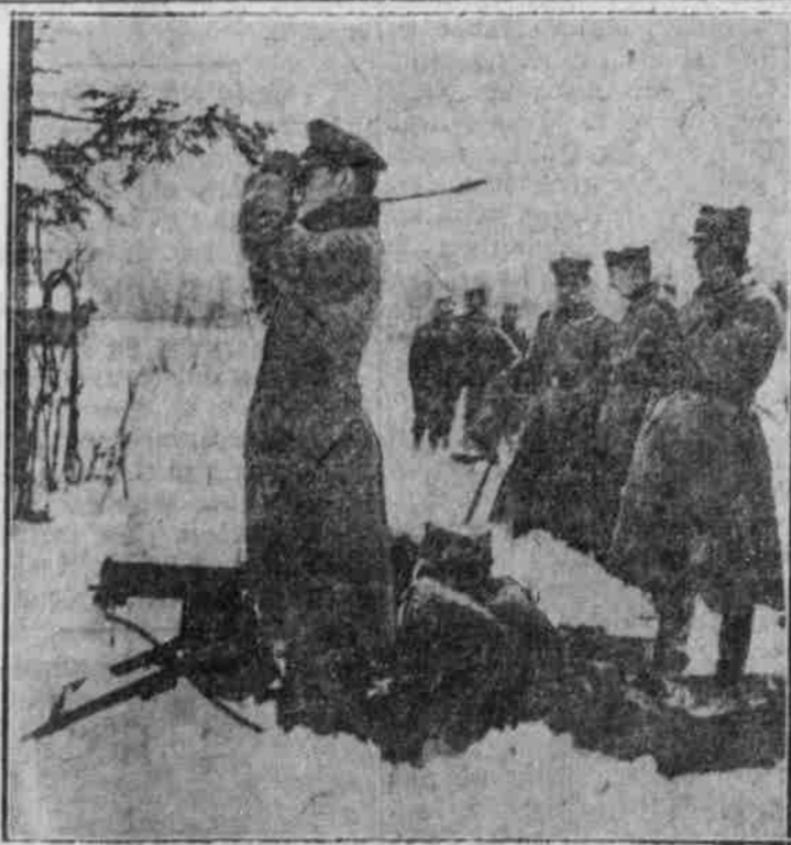
Deutsche Maschinengewehr-Abtheilung in den Schneefeldern der Hohefen.