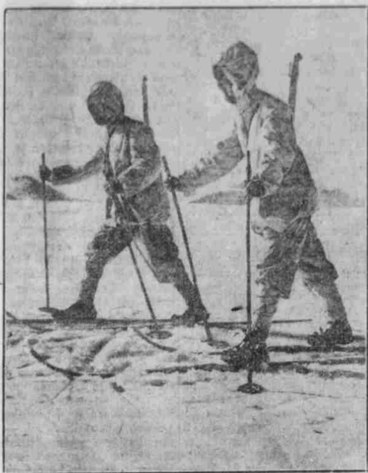
Deutsche Skipatrouille in der neuen Schneenorm.