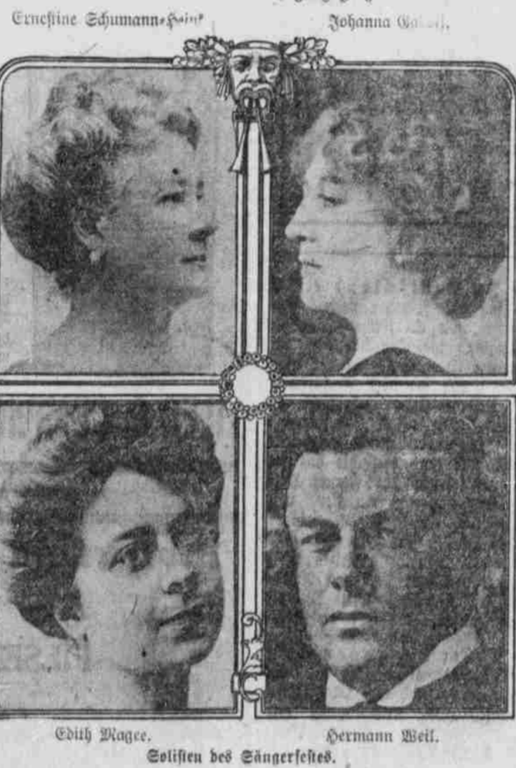
Solisten des Sängereises.

Der Wunsch, eine recht große Beteiligung zu erzielen, war für die Brooklyner Festbehörde maßgebend, das diesjährige 21. National-Sängerfest nicht für die heißen Sommermonate anzusetzen, sondern in die frischen, angenehmeren Frühlingstage vom 29. Mai bis 2. Juni zu verlegen. Man verspricht sich von dieser Änderung viel, und die zahlreichen Anmeldungen sind wohl der beste Beweis dafür, daß die Brooklyner Sänger mit dieser Änderung einen Schritt in der rechten Richtung getan haben. Die bereits eingehenden Anmeldungen zur Teilnahme besitzend auch einen andern Grund, der in den letzten Monaten vielfach erhoben und besprochen wurde. Der Krieg und die „schönen Zeiten“ wurden nicht einmal, die höchsten Male als unüberwindliche Hindernisse für den Erfolg des Brooklyn-Sängerfestes hingestellt. Nun mag es in richtig sein, daß viele Geschäftsleute durch den Krieg und die derzeitigen wirtschaftlichen Schwierigkeiten in Mitleidenschaft gezogen worden sind. Ebenso bekannt aber ist auch die Tatsache, daß die Lage im Allgemeinen durchaus nicht bezwart ist, daß sich der Arbeiter oder Bureau-Angestellte jedes Vergnügens verweigern muß. Und der Krieg? Zugegeben, daß der Deutsche, der Österreich oder Ungar, dessen Vater und Verwandter durch einen Krieg, der Leberjagd grimmer Feinde gegenüber-