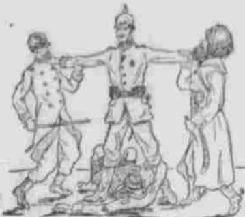
It's a long long way to dear old Berlin.

Der „Küch. Web.“ wehrt zu einem Auser Gehilfen wehrt sich ein gefangener ungarischer Soldat, der an der Hand verwundet worden war, lang, seine Wunde zu heilen. Als der Militär darauf bestand, fiel mit dem Hand die Fahne des Regiments, in dem der Ungeheuer dient und die er um den Körper gefangen hatte, zu Boden. Weidend trennte der Soldat sich von ihr.