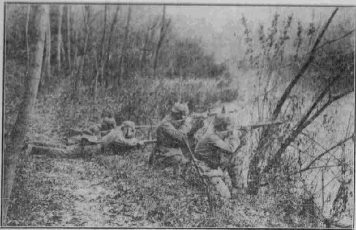
Schleichwache an der Front.