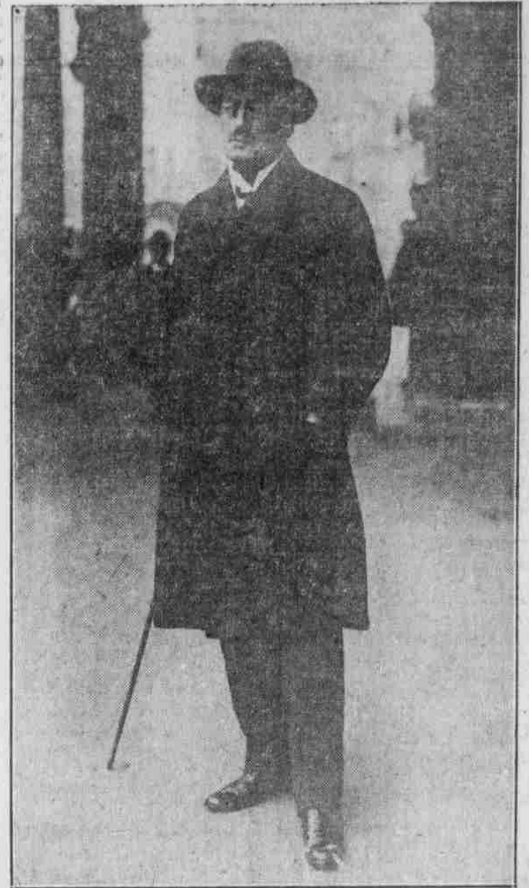
Sven Hedin, der schwedische Forscher, der ein begeistertes Buch über die deutsche Armee geschrieben hat.

Unabiges Urteil. Das Kriegsgericht in München verurteilte den in Traunstein untergebrachten