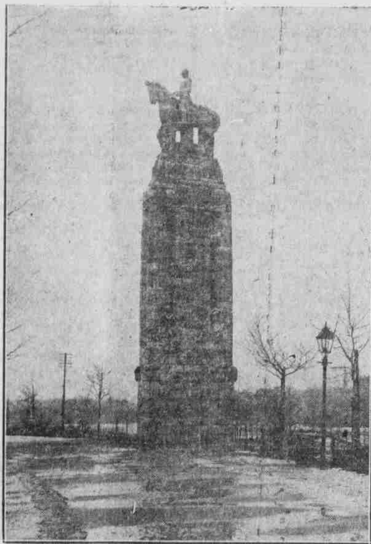
Das Bismarck-Denkmal in Kärnten, das während des Krieges enthüllt wurde.