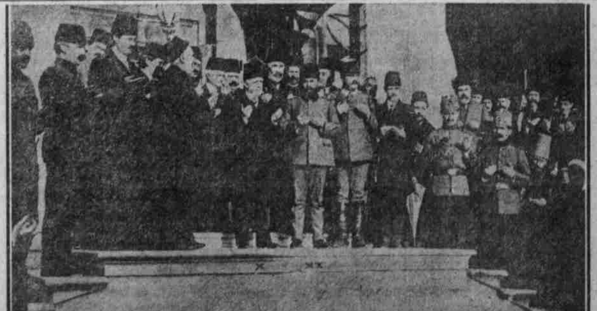
Weber der türkischen Minister und der ins Feld ziehenden Offiziere auf dem Platz vor der hohen Pforte in Konstantinopel. (Großvezir Feiz Said Sali: (X), der bisherige Marineminister und jetzige Oberkommandirende gegen Ägypten General Djemat Pascha (XX).