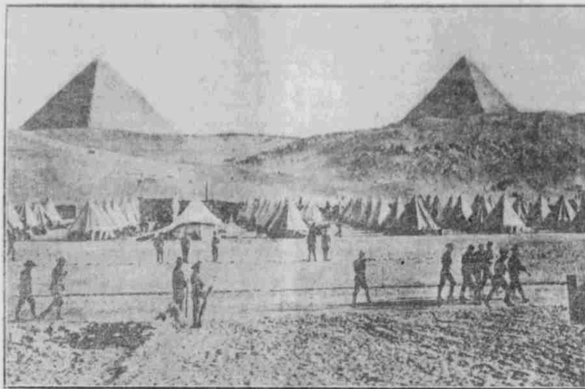
Ein von den Engländern errichtetes großes Zeltlager für die australischen Hülfskräfte am Fuße der Pyramiden in Ägypten.