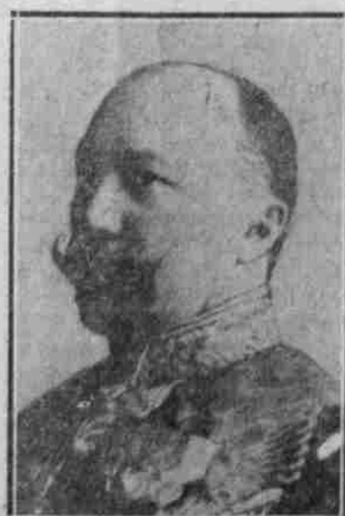
Der russische Finanzminister B. Warf, der die neue russische Finanzaktion einleitete.