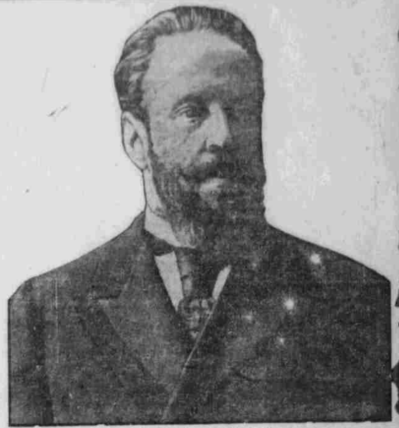
† Graf Sergej Jusjowitsch Witte.