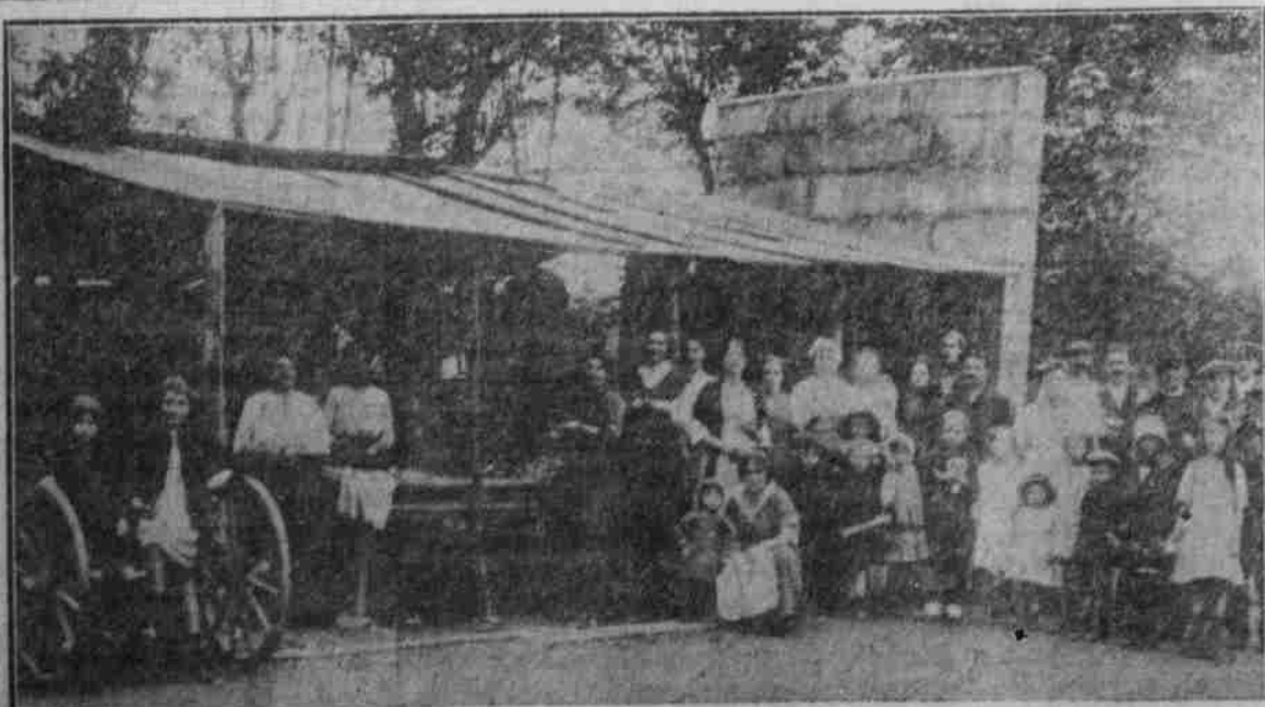
Offene Küche für die 1200 Internierten.