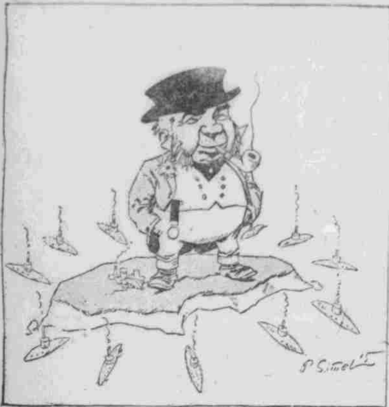
John Bull: „Gott sei Dank, ich bin blockiert, ich brauch' keine Truppen mehr 'rausgeschickt!“