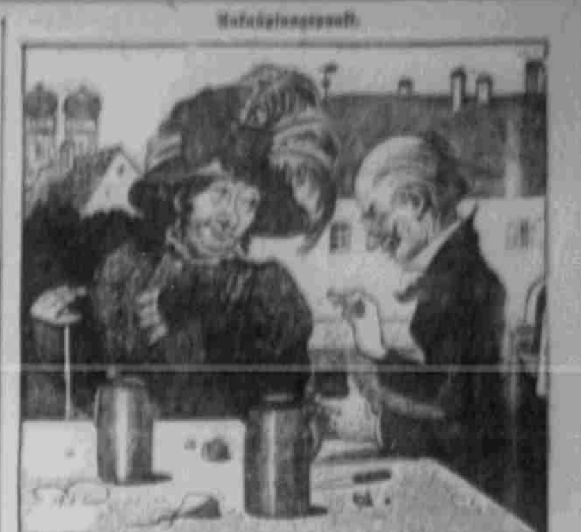
Schäbterner Herr: „Fräulein — — — — — wie leicht eine Pflanz gewiss!“