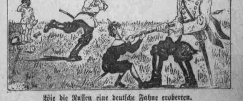
Wie die Russen eine deutsche Fahne eroberten.