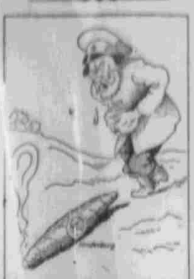
Starker Tabak oder Karte „Gindenburg“.