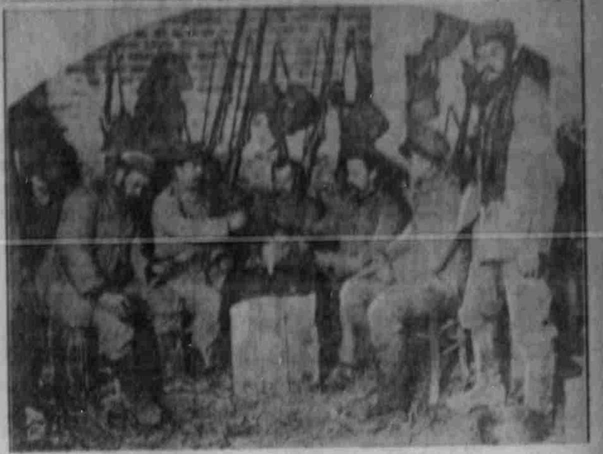
Ein gemütlicher Platz in den Kantine von Neuweier.