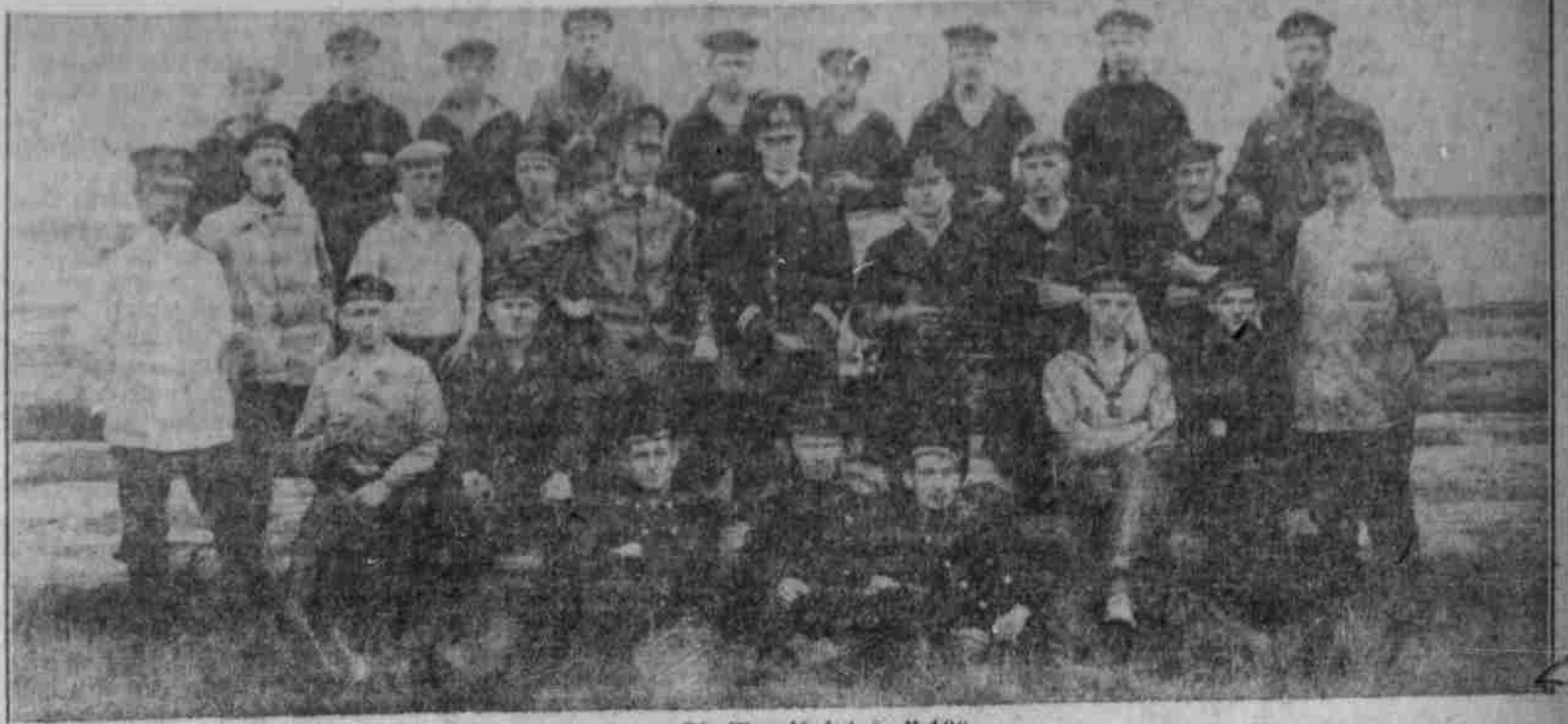
Die Mannschaft des „U 10“.

Nach Angabe des türkischen Generalstabs hat die alliierte Flotte bisher nur die alten Festungs-Anlagen angegriffen, die modernen Forts aber überhaupt noch nicht erreicht.