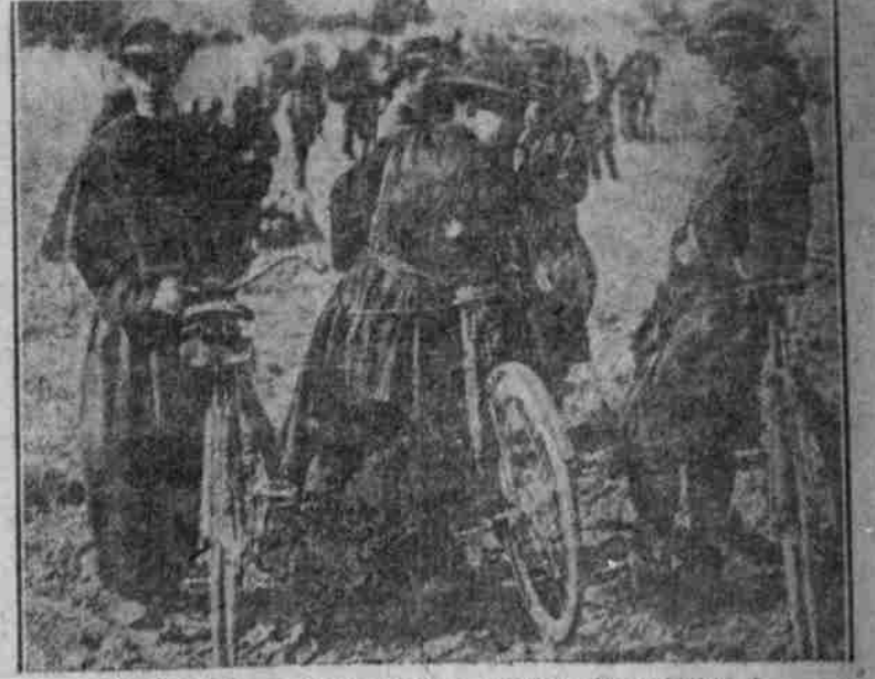
Mit Fahrrädern ausgerüstete französische Feldgeistliche.