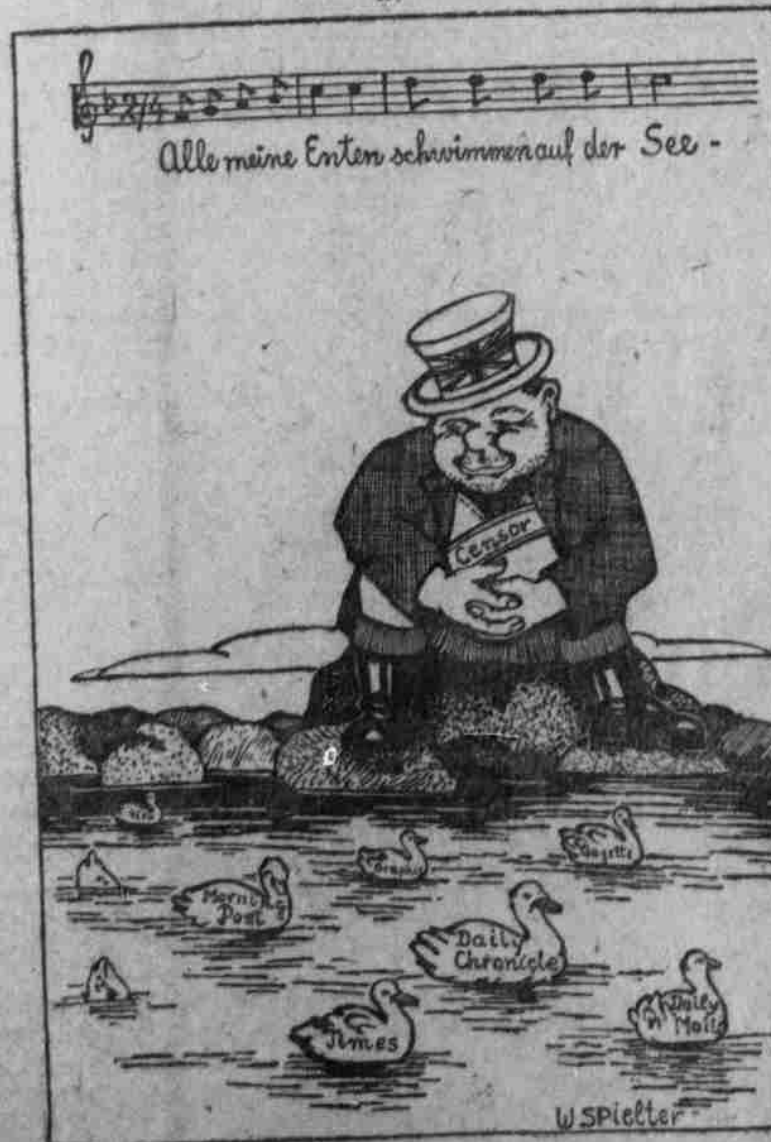
Illustrationen zu deutschen Volksliedern.

„Feindliche — Kellner.“ In Liverpool hat eine Versammlung englischer Hotel- und Restaurantangestellter stattgefunden, in der die Resolution angenommen wurde, entgegen gegen die Absicht des Ministeriums des Innern zu protestieren, internierte Unterthanen fremder Staaten freizulassen, um den Fortschritt zu Dienstpersonal zu verhelfen. Man will an das Publikum appellieren, sich nicht von „feindlichen Kellnern“ bedienen zu lassen.