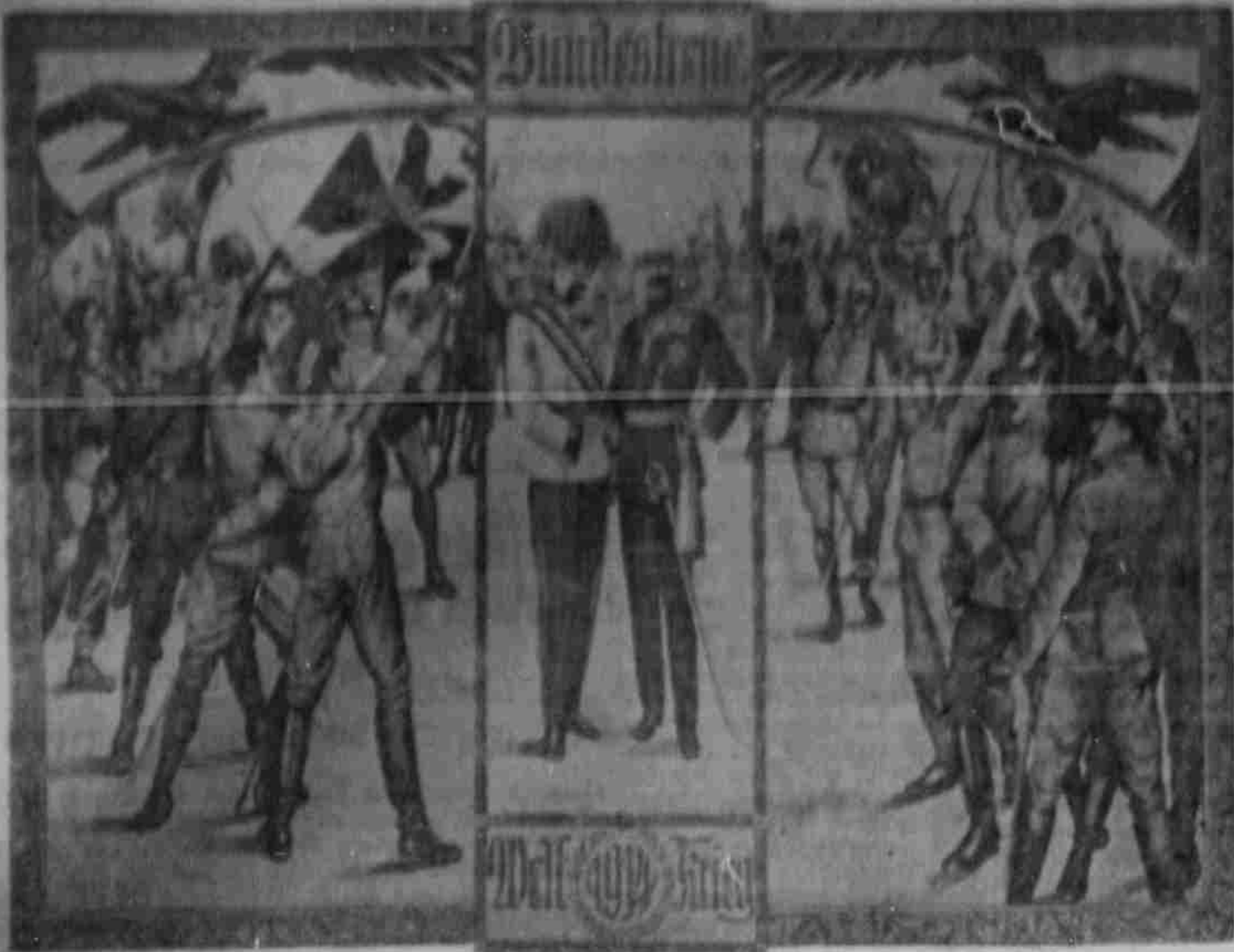
Offizielles Gedenkblatt vom A. & N. Kriegsfürsorgamt.