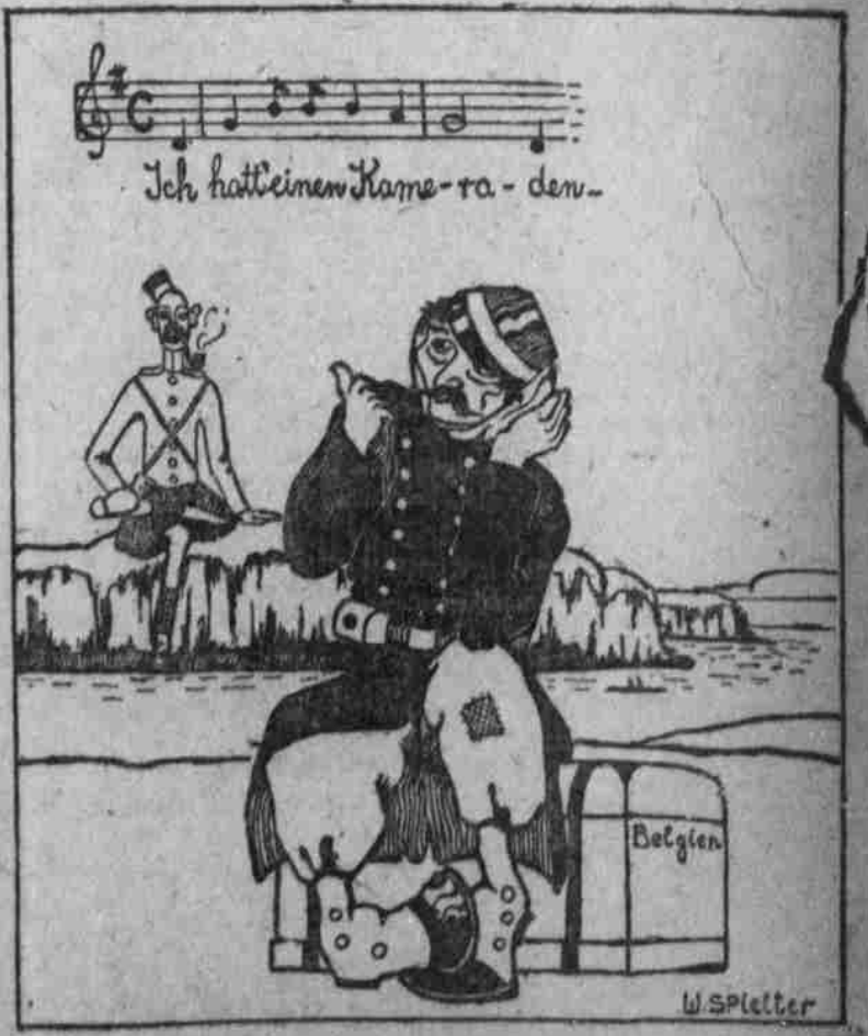
Illustrationen zu deutschen Volksliedern.

„Feindliche — Kellner.“ In Liverpool hat eine Versammlung englischer Hotel- und Restaurantangestellter stattgefunden, in der die Resolution angenommen wurde, entgegen gegen die Absicht des Ministeriums des Innern zu protestieren, internierte Unterthanen fremder Staaten freizulassen, um den Fortschritt zu Dienstpersonal zu verhelfen. Man will an das Publikum appellieren, sich nicht von „feindlichen Kellnern“ bedienen zu lassen.