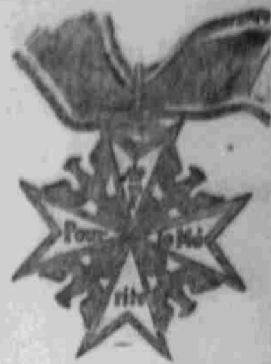
Orden pour le mérite.

Die Preussische Eisenbahnverwaltung hat reinigt 600,000 Kilogramm Müll.