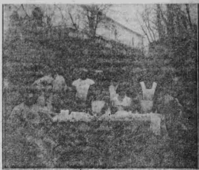
Im Lazareth Germersheim.