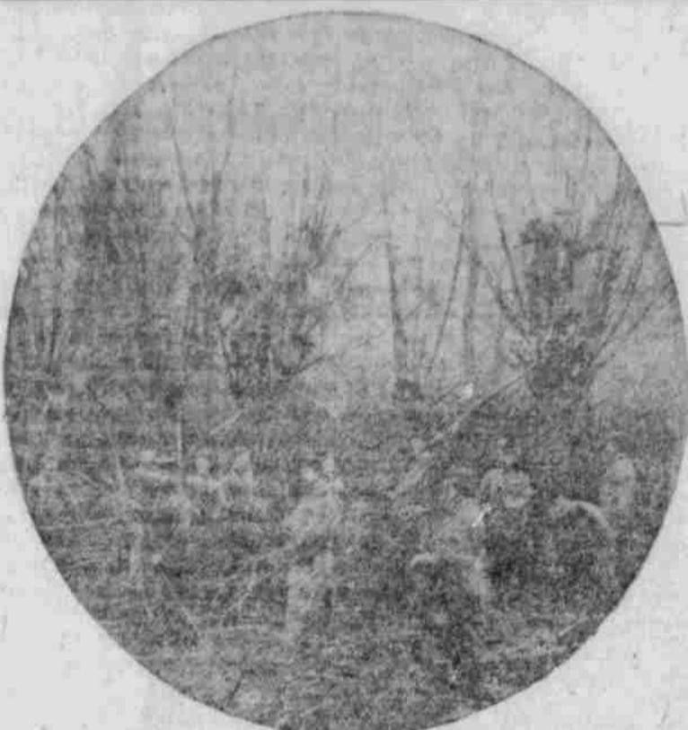
Schneiden von Weidenruten für die Schützengräben.