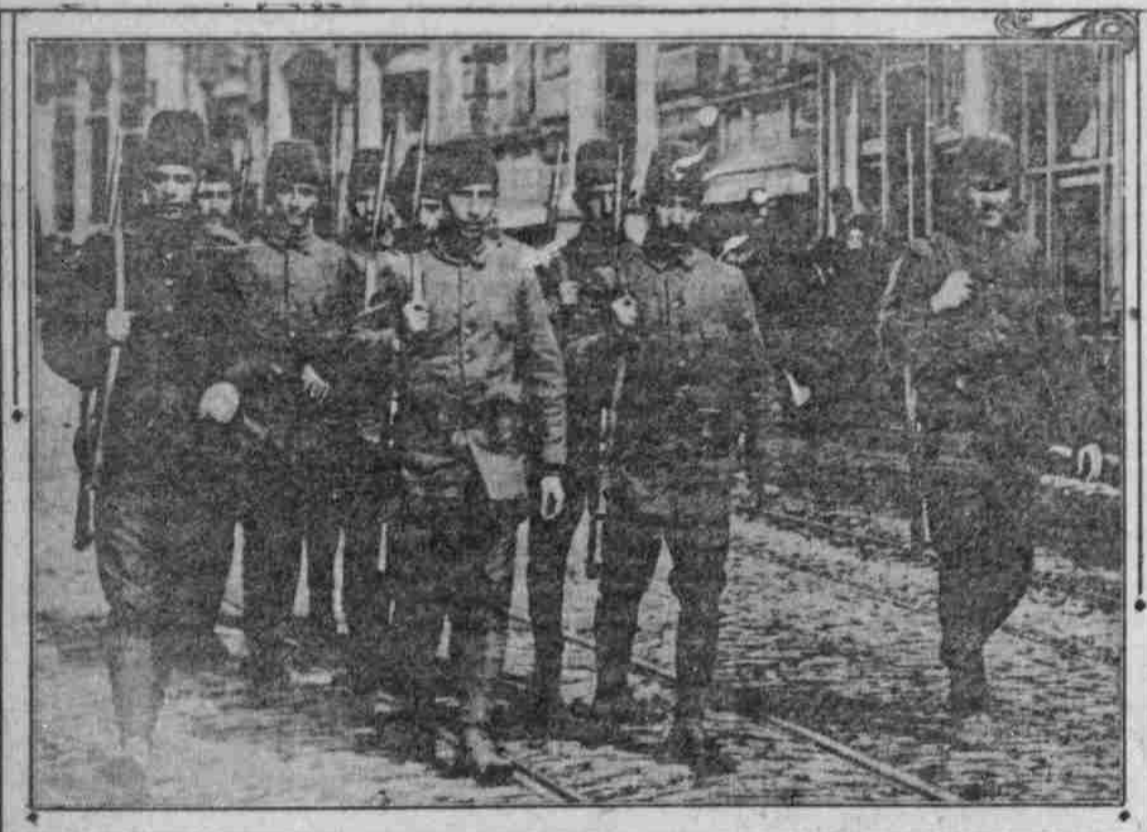
Eine Patrouille in den Straßen Konstantinopels.