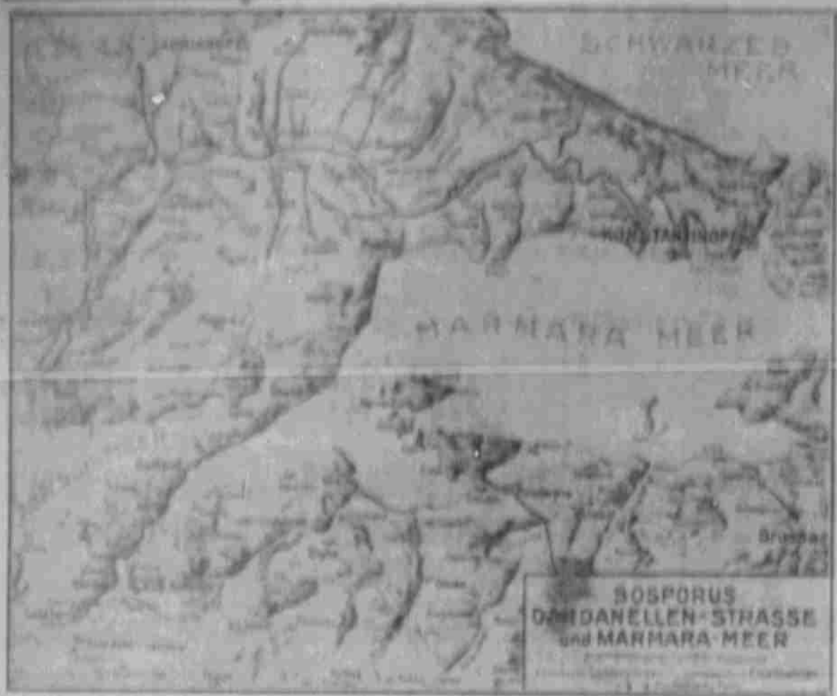
Die Tschamtschen sind ursprünglich aus einem türkischen Stämmchen und französischer Schiffe befreit worden, wobei die Konstantinopel meidet, die Schiffe der Kaiserin, darunter ein Kriegsschiff, führte nach dem Hafen der Stadt vertrieben wurden.