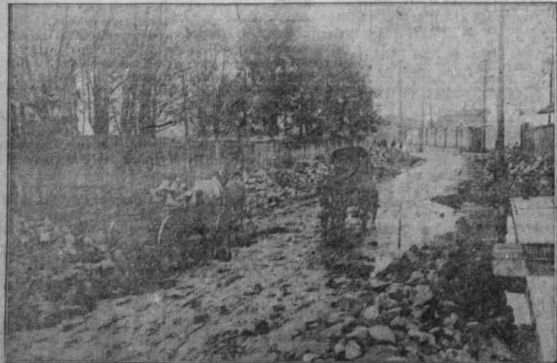
Die Bahnhofsfrage in Koblenz.

(Für das „Kriegsblatt“ gezeichnet von W. Spetter.)