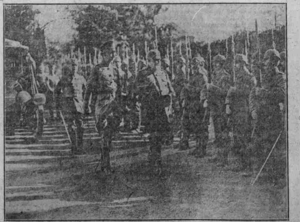
Der Kronprinz und der König von Württemberg schreiten die Front ab.

Dekoration. „Und heut' Abend, mein Lieber Herr Leutnant, wollen wir Ihr Eisernes Kreuz mit einem Gläschen Sekt feiern.“ „Verzeihung, Herr Oberst, ich bin Anti-Alkoholiker.“ „Na, dann nehmen wir einen Leichten Burgunder.“