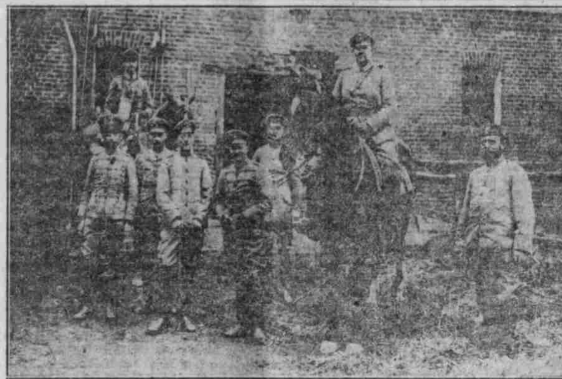
Prinz Eitel Friedrich von Preußen auf dem westlichen Kriegsschauplatz.