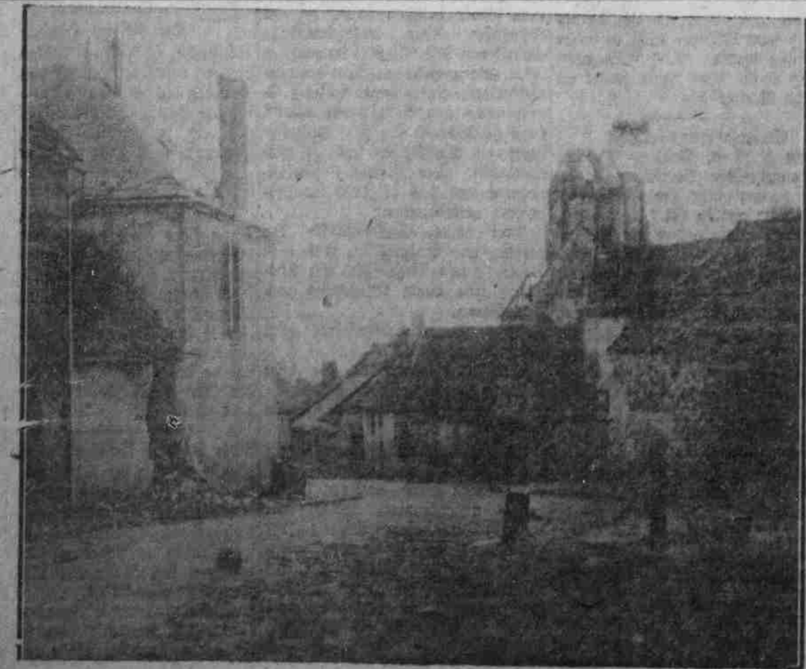
Die zerstörte Kirche des Dorfes Cherbogne.