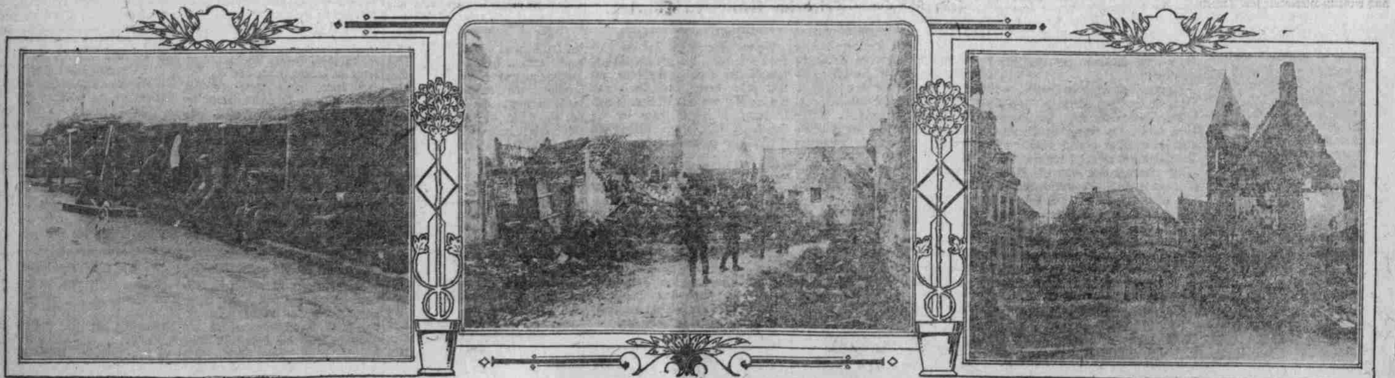
Die von deutschen Soldaten in Dailly erbaute „Hüttendorfsstraße“.