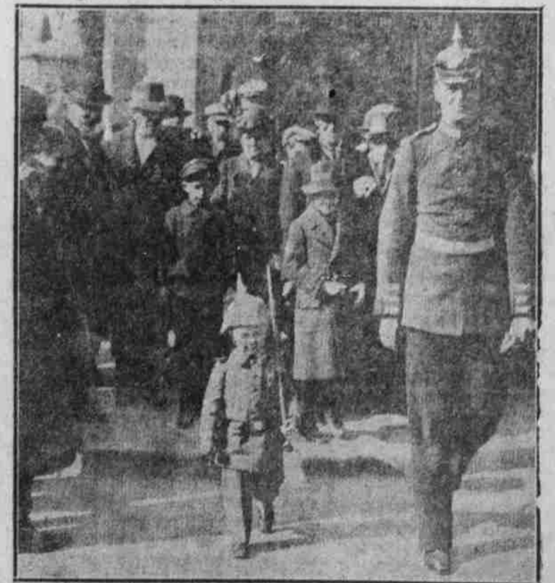
Der kleine Vaterlandsvertheidiger.