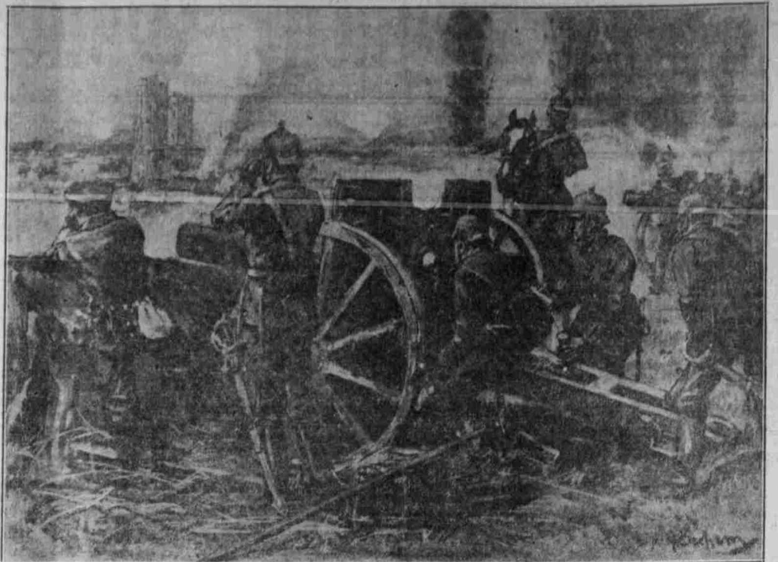
Die Beschießung von Rheims in voller Thätigkeit.