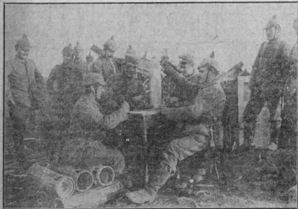
Während einer Gefechtspause bei der Artillerie.

Die Deutschen haben die Alliierten vor Soissons in einer dreitägigen Schlacht über die Aisne geworfen und dort sechs Ortschaften im Sturm genommen. Die Verluste der Franzosen betragen 30,000 Mann. — Nördlich von Verdun, im Argonnenwald, und südlich, wo, bei St. Mihiel, der deutsche „Pfeil im Fleische Frankreichs steckt“, haben die Deutschen weitere Erfolge errungen.