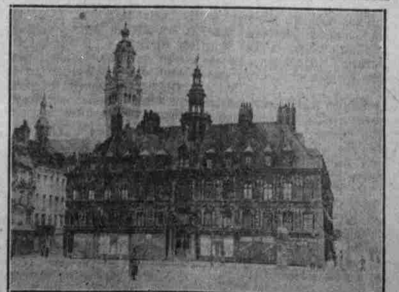
Die Börse von Lille.