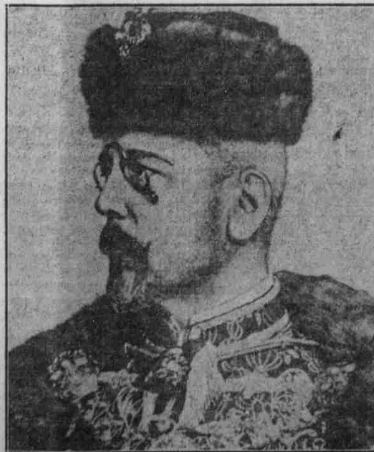
Stephan Frh. Burian v. Rajecz. Der neue österreichisch-ungarische Minister des Innern.