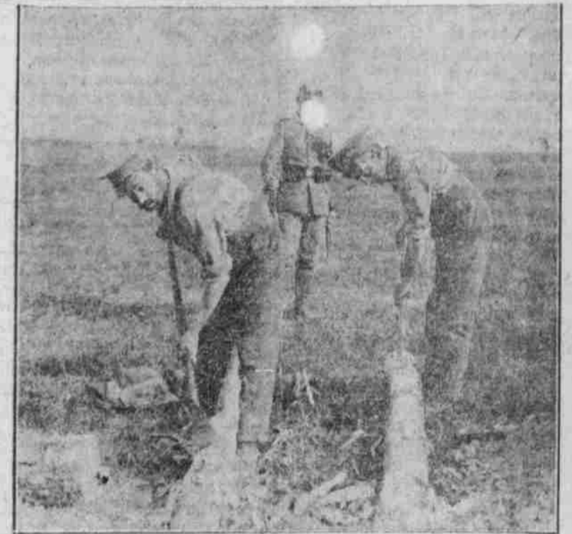
Englische Gefangene bei der Arbeit.