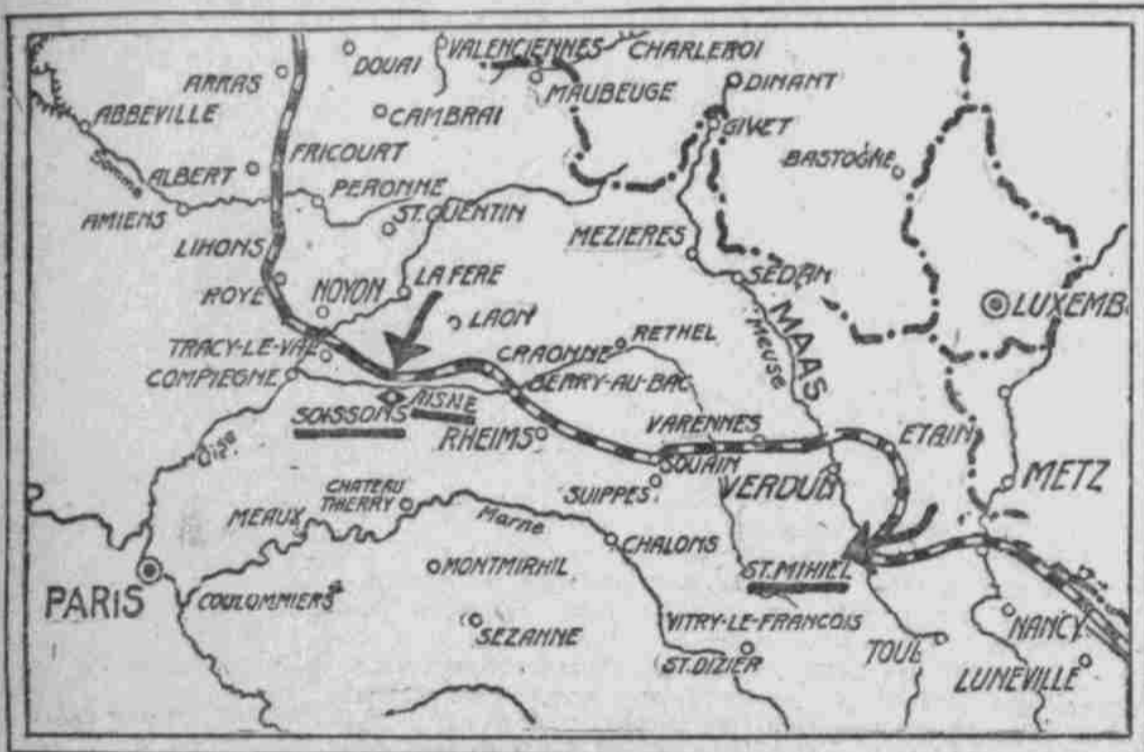
Situationsplan des westlichen Kriegsschauplatzes.

Die Deutschen haben die Alliierten vor Soissons in einer dreitägigen Schlacht über die Aisne geworfen und dort sechs Ortschaften im Sturm genommen. Die Verluste der Franzosen betragen 30,000 Mann. — Nördlich von Verdun, im Argonnenwald, und südlich, wo, bei St. Mihiel, der deutsche „Pfeil im Fleische Frankreichs steckt“, haben die Deutschen weitere Erfolge errungen.