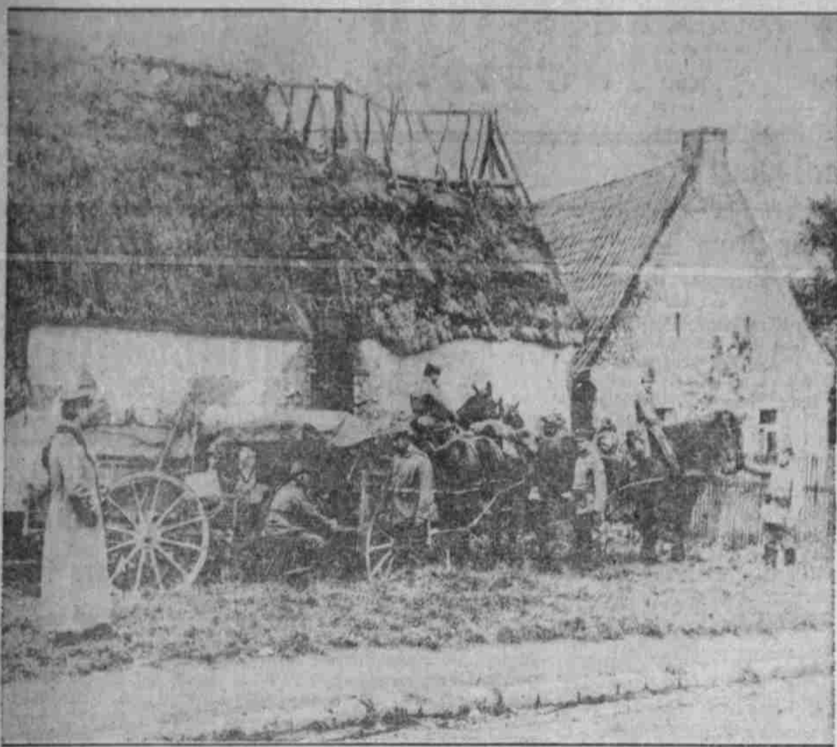
Wagenstation einer bayerischen Fernsprech-Abteilung in telefonischer Verbindung mit dem Oberkommando.