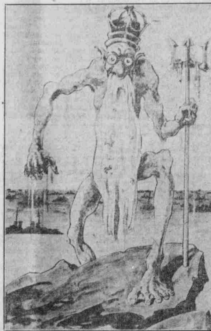
Neptun verläßt die Nordsee, da es ihm da nicht mehr geheuer vorkommt, und begibt sich nach ruhigeren Gewässern.