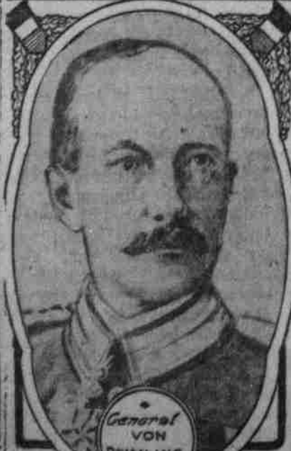
General VON DEIMLING.