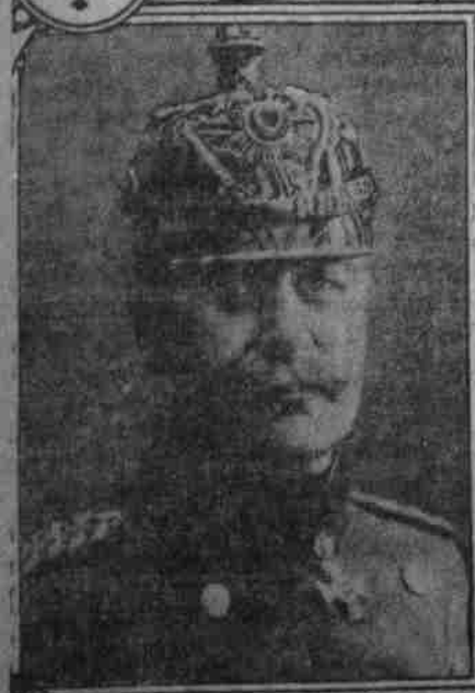
General von der MARWITZ.