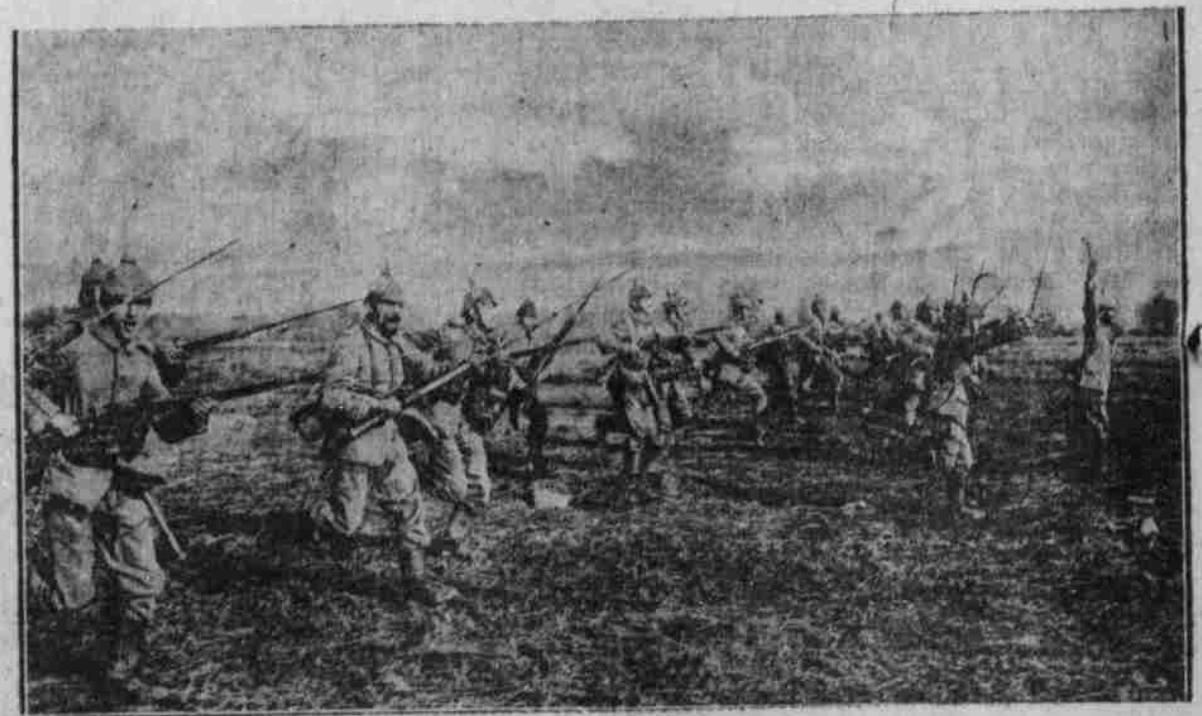
Deutsche Truppen stürmen eine feindliche Stellung.