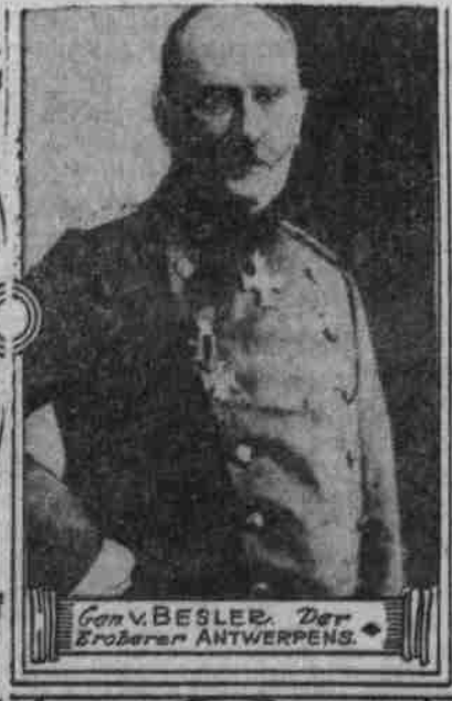
Gen. v. BESLER. Der Eroberer ANTWERPENS.