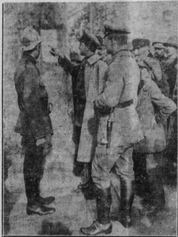
Feuerwehrlente als Polizei und Dolmetscher. Unser deutsche Soldaten lassen sich von einem Feuerwehrlente, der zu gleicher Zeit Polizeidienste verrichtet, einen durch die polnischen Jungschläger gemachten Anschlag erklären.