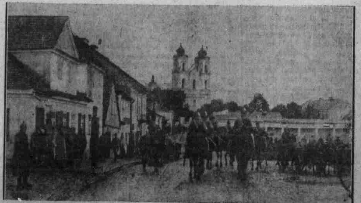
Deutsche Truppen in einem russischen Orten 1914.