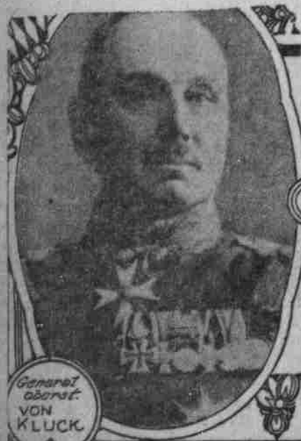
General von KLUCK.