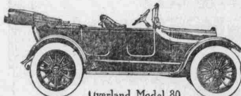
Overland Model 80