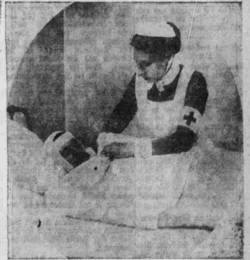
Ein verwundeter Krieger.