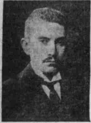
Fürst Sigmundsky (seitlich in London).