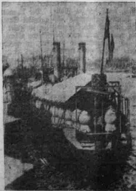
Ein Boot mit Minen.