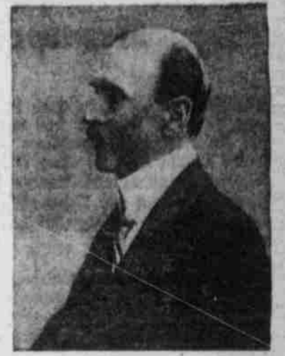
Graf v. Bismarck (seitlich in Rom).