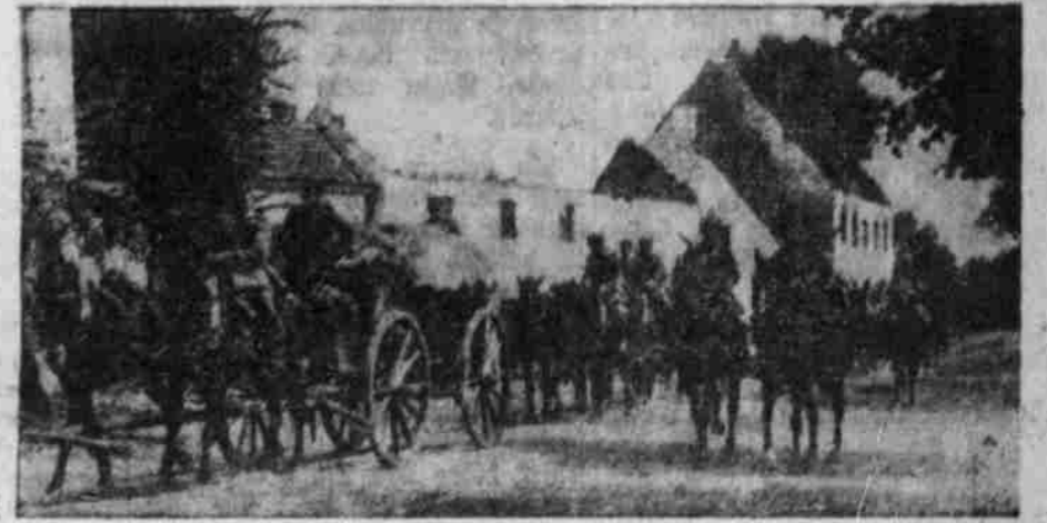
Deutscher Jouragewagen in Duse.