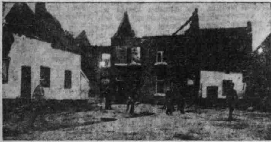
Die Ruinen von Moulamb.