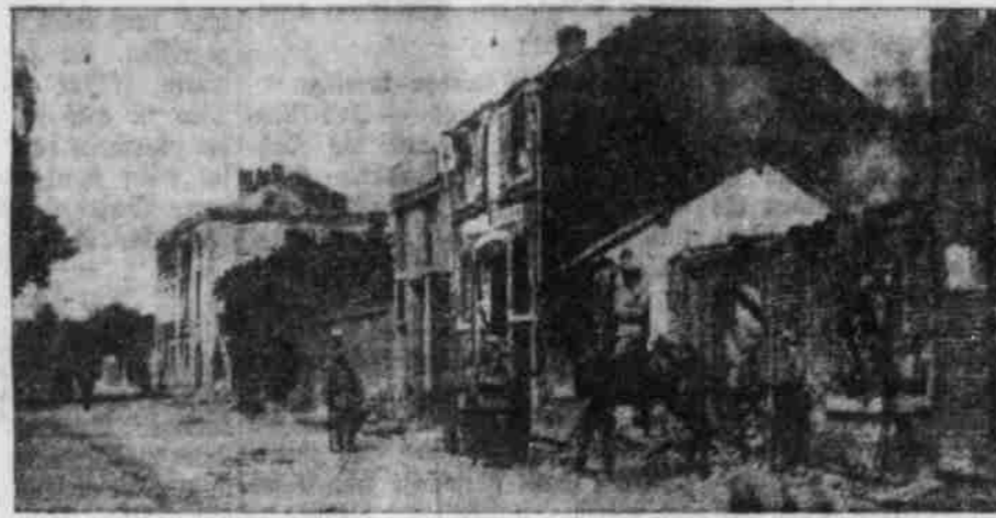
Die Ueberreste von Duse.