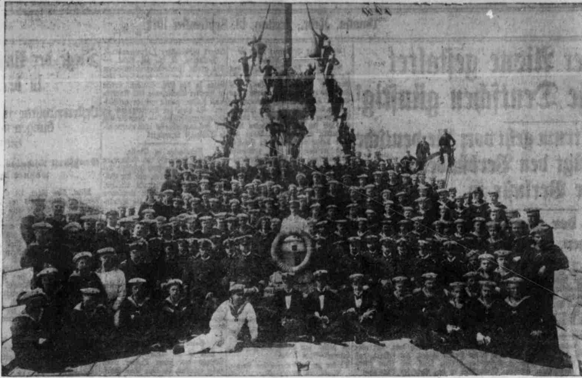
Die Mannschaft der „Nürnberg“. — Ein englischer Dreadnought verfolgt den deutschen Kreuzer.