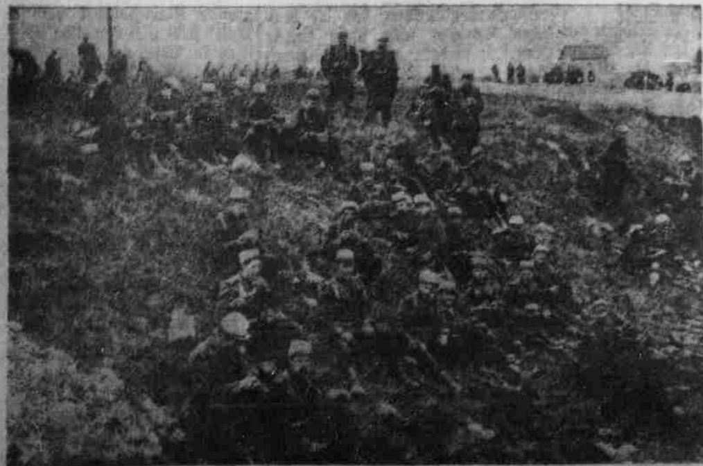
Französische Infanterie auf Raft.