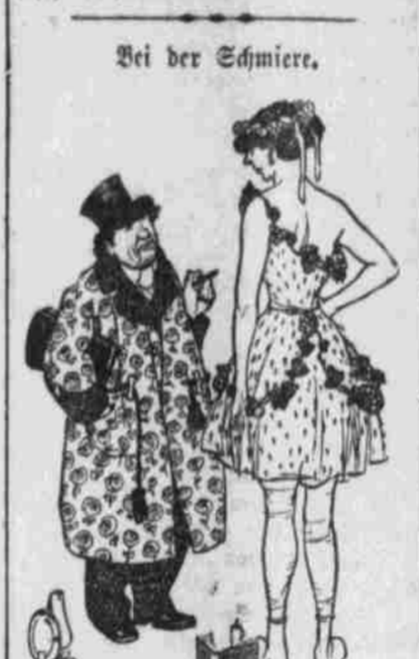
Bei der Schmie...