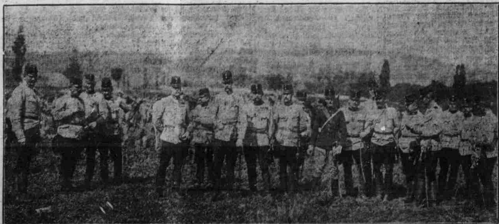
Erzherzog Eugen im Kreise seiner Offiziere.

Konservebieren des Jah- res. Ein sehr gutes Mit- tel hierfür besteht darin, daß man die Zähne nebst Zahnfleisch öfters mit einem Salbeiblatte reibt. Die Eng- länder haben eine kleine Schachtel mit Salbeiblättern in ihrem Wasch- tisch, um jeden Morgen Gebrauch da- von zu machen. Besonders ist auch bei Krankeiten nach dem Genuß von starken Tropfen, welche nicht selten die Zähne zerstören, die Anwendung eines Salbeiblattes zu empfehlen und dann den Mund mit Wasser auszu- spülen.