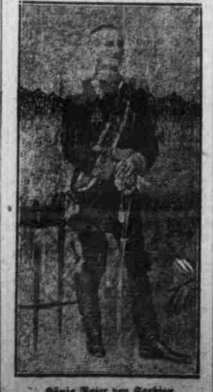
Einige Jahre von Berlin.

Gutes Mittel gegen nervöses Herzklappen sind Einreibungen der Herzgegend mit Senfspiritus, kalte Umschläge auf die Herzgegend, allgemeine kühle Abreibungen, Valerianer, Baldriantropfen und Sassafras-tropfen zu gleichen Teilen gemischt, Trinken von Jodwasser mit Soffmannstropfen, Brausepulver. In schweren Fällen wendet man Senfteig oder Senfpapier an oder legt geriebenen Meerrettich auf.