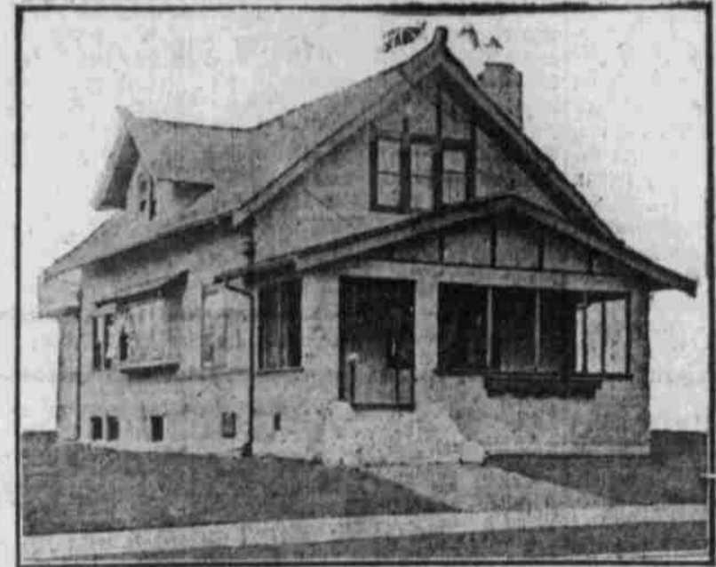
Perspektive Ansicht—Von einer Photographie.