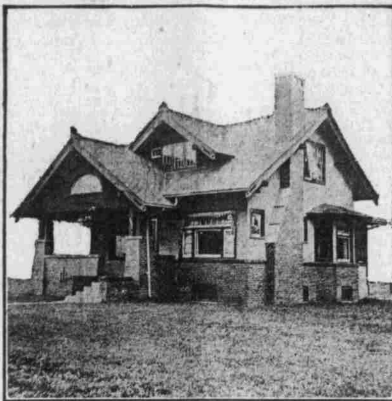
Perspective Ansicht—Von einer Photographie.