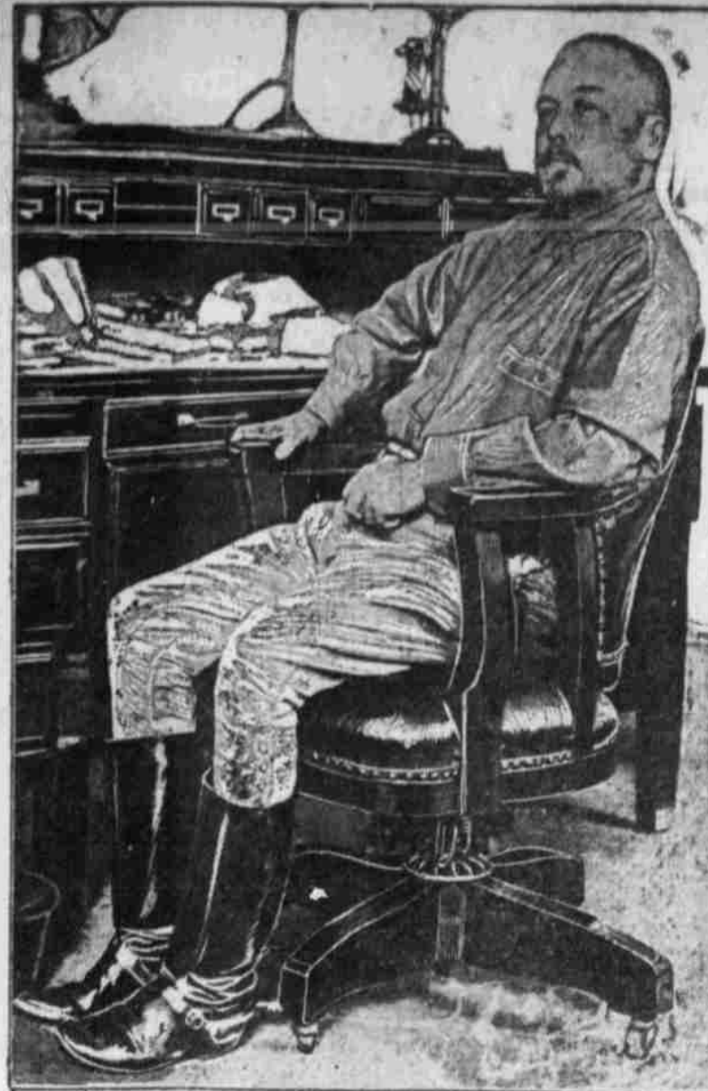
General Johnston, der Befehlshaber der Bundestruppen an seinem Pult