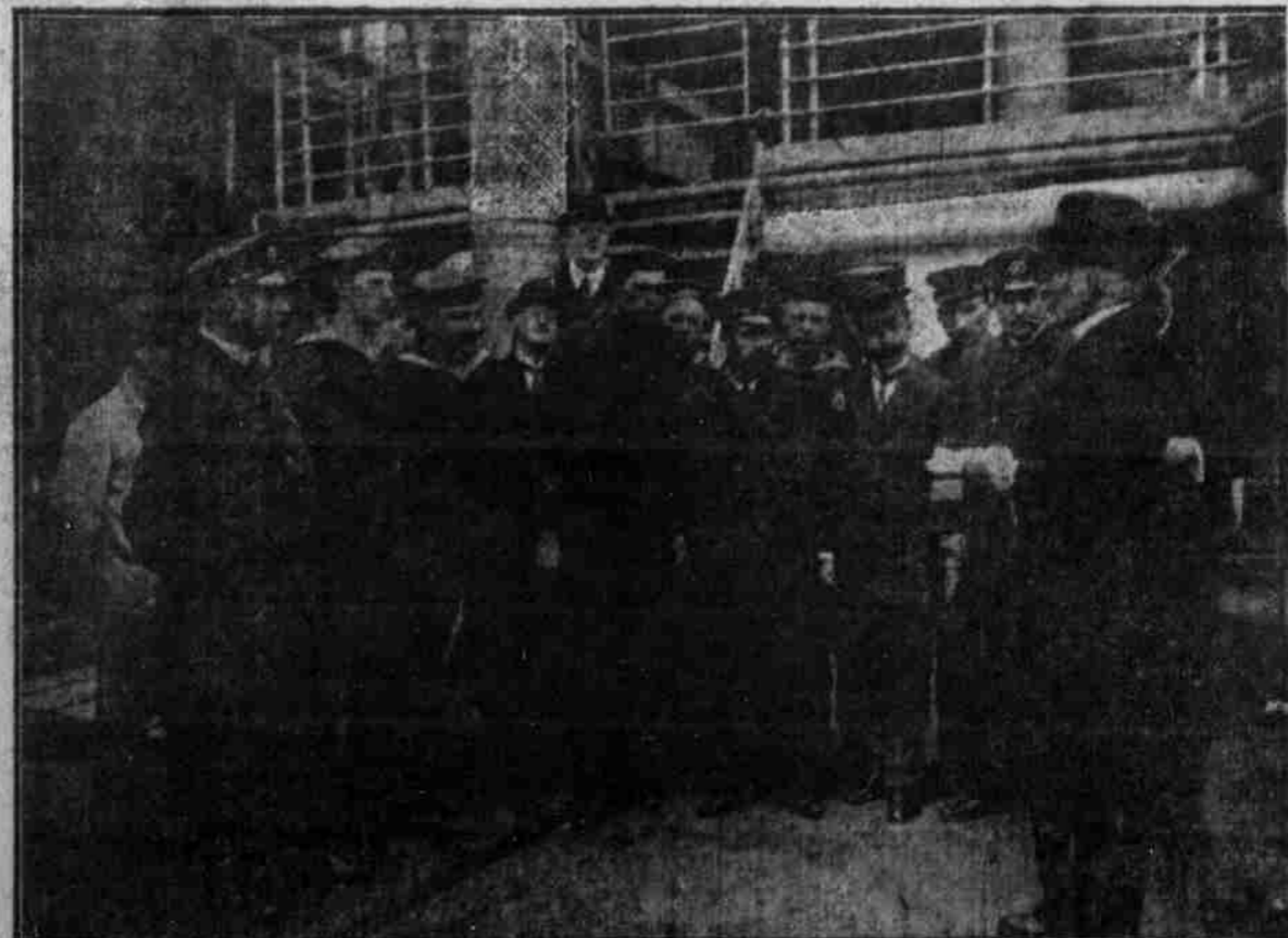
Die Deutschen-Dreier Dampfer „Svein“.

Im 83. Lebensjahre ist der glänzende Romanist und Dichter in München gestorben.