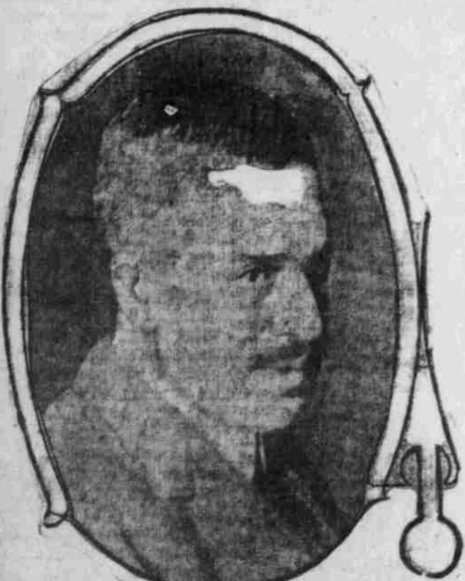
Polizeikommissär Arthur S. Wood. Das neuernannte Oberhaupt des New Yorker Polizei.

Die durch die Home Rule-Wirren in Irland verurteilten Differenzen in der britischen Armee führten zu einer der bedenklichsten politischen Krisen die seit Jahren in England vorgekommen sind. Als britische Truppen den Befehl erhielten, die Garnisonen in Ulster zu verstärken, da ein Ausbruch der Freiwilligen zu gewärtigen stand, welche die Unionisten von Ulster organisiert hatten, um der Durchführung der Home Rule Widerstand zu leisten, quittierten viele Offiziere, um nicht gegen die Unionisten kämpfen zu müssen, mit welchen sie in vollem Meinungsbeiklang stehen. Sie wurden vom Kriegsrat rehabilitiert, doch Premier Asquith ließ diese Maßnahme um. Dies führte zum Rücktritt des Kriegsministers Seely, des Oberkommandeurs der Armee, Sir John French und anderer. Der Name des Königs wurde gelegentlich der Debatten im Unterhause in die Sache hineingezogen. Das obere Bild zeigt die Uniformierung der britischen Infanterie in Irland. Unten, zur Linken ist das Bildnis des Königs während das Bild zur Rechten Premier Asquith zeigt, der einer verhängnisvollen Krise vorbeugte, indem er zu seinen übrigen Pflichten auch noch die des Kriegsministers übernahm.