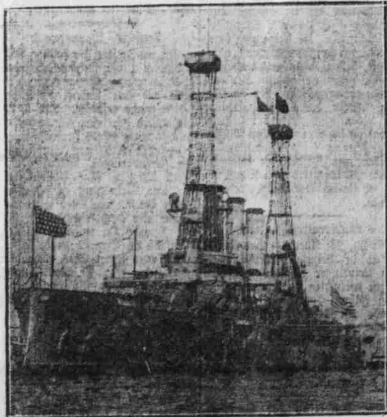
Schlachthaus „Slaughter“, den New Yorker Hafen verlassen.

In Frankfurt-am-Main wurde Karl dem Großen, dem Gründer der Stadt, ein neues Denkmal gesetzt.