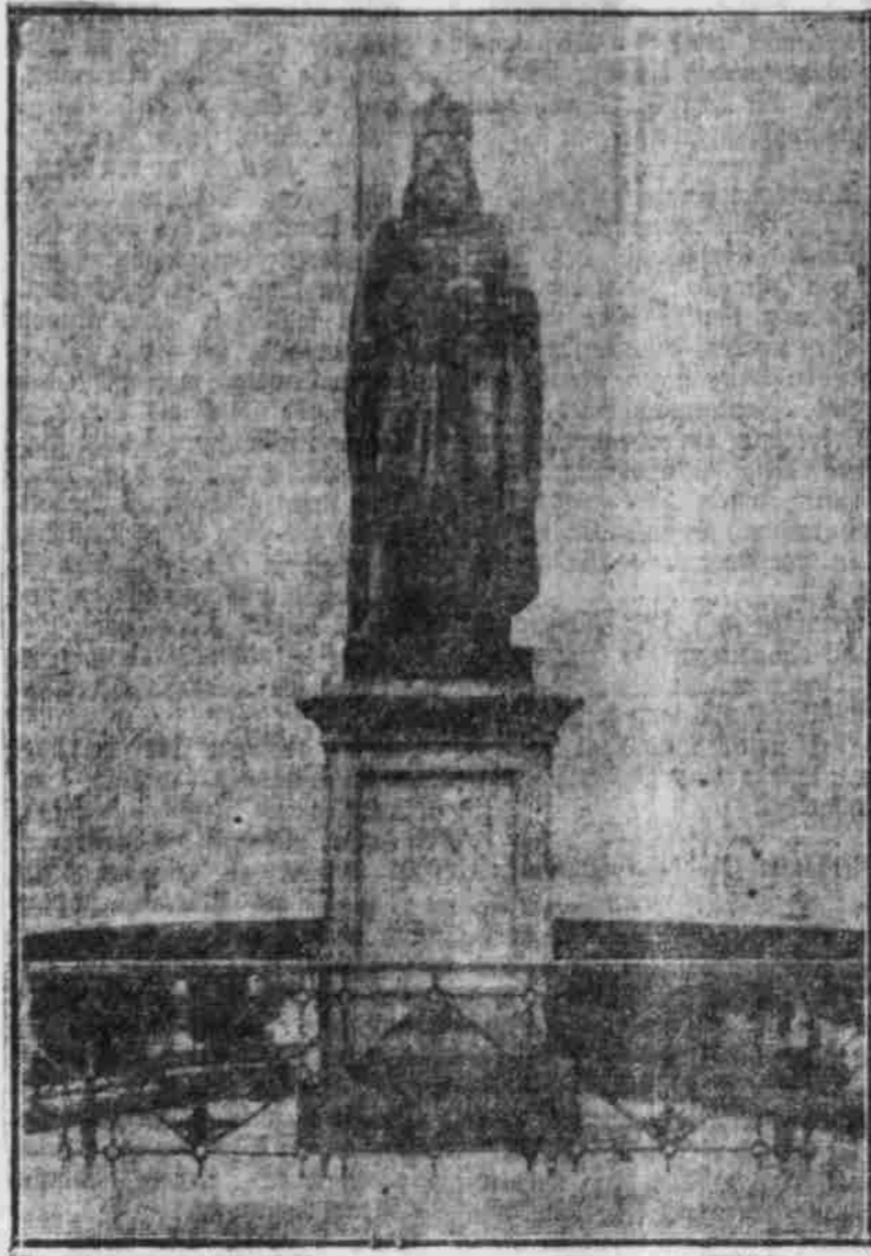
Kaiser Karl Denkmal.

In Frankfurt-am-Main wurde Karl dem Großen, dem Gründer der Stadt, ein neues Denkmal gesetzt.