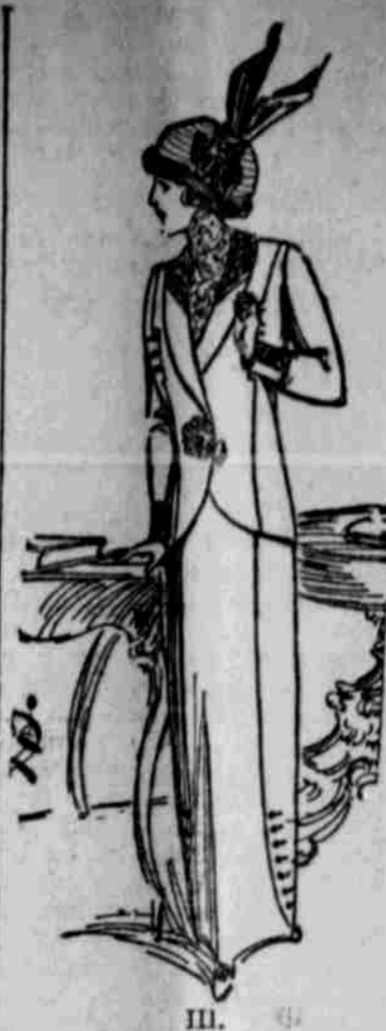
III. Täuschlich und ähnliches noch verstärkt wird.

Selbst die Straßentüme bleiben von diesen Bemühungen nicht unbeteiligt, obgleich sie hier naturgemäß nur angewendet werden können. Immerhin vermissen die kurzen Boleros, die häufig in langen und ziemlich weit geschnittenen Schmalenbändern auslaufen, die Taillenslinie fast vollständig, ein Eindruck, der durch lose Westenteile, leicht übergenommene