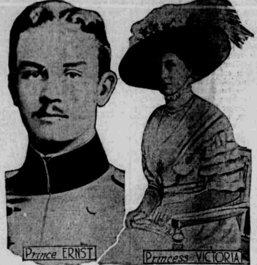
Die Verlobung des Prinzen Ernst August von Cumberland mit der Prinzessin Viktoria Luise, der einzigen Tochter des deutschen Kaisers, hat in ganz Deutschland Freude herbeigeführt.