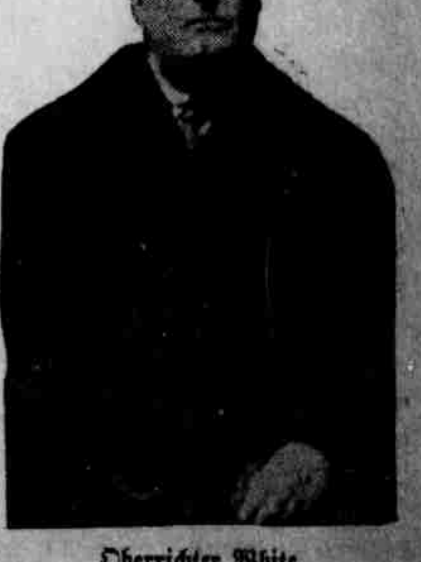
Dberichter White, welcher dazu ausgerufen ist, den erwählten Präsidenten Wilson am 4. März zu vereidigen.