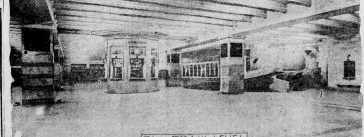
The TRAIN LEVEL