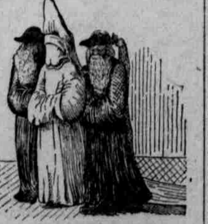
Kurfürstin Dorothea beim Begräbnisse ihres Gemahls, des großen Kurfürsten.