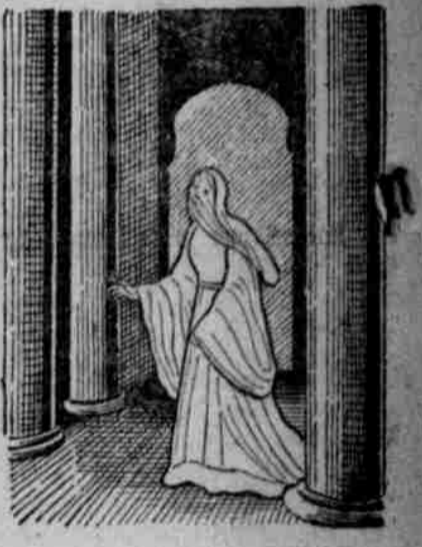
Die weiße Frau.

Ueber die weiße Frau im Königschloße zu Berlin an der Spree mag auch mancherlei Erstes und Letztes zu berichten. Brandenburgisch-preussische Hofprediger schworen heilige Eide, ihr gegenübergefunden zu haben, und Friedrich I., der erste König von Preußen, farb in der Ueberzeugung, daß die weiße Frau ihm sein nahes Ende gemeldet habe. Des Königs dritte, geistreiche Gemahlin, Sophie Luise von Mecklenburg, hatte sich unbewußt aus ihrem Gemache entfernt und war, nur leicht geteufelt, mit blutigen, an einer Scheibe gerichteten Händen untermelt vor ihm getreten, während er in seinem Arm-