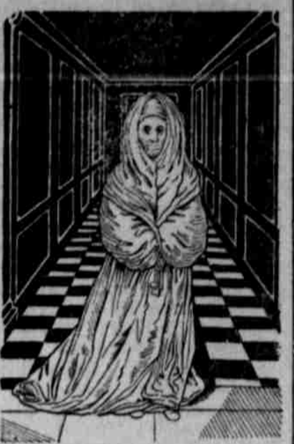
Die berühmte weiße „weiße Frau“ des Berliner Schloßes.

Am intensivsten hat sich, wenn der Ausdruck erlaubt ist, die weiße Frau als Hohenzollerngespenst betätigt. Nur konnten sich die hochgelehrten Herren, die ihre Geschichte geschrieben haben, niemals über ihren Ursprung untereinander einigen. Sie soll eine Gräfin von Orlamünde gewesen sein, so