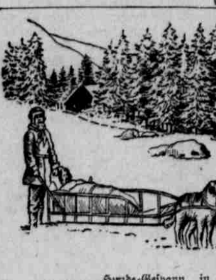
Hunde-Gespann, in Doppelreihe geschleift.

Der Korb-Schlitzen ist größer, bis zu 15 Fuß lang, hat eine Spur-Weite von 22 Zoll und trägt, wie sein Name sagt, einen Korb, in welchem die Ladung gepackt wird, und aus welchem hinten ein Paar Schwänge herborstehen, die zum Steuern benutzt werden. Aus Birken, Eichen- oder Hirschenholz gebaut, kostet er 40 bis 200 Dollars. Der Korb-Schlitzen ist ein einziger Fuß oder mehr über die „Läufer“, welche unter gewöhnlichen Umständen aus Stahl oder Messing bestehen, obwohl bei ungewöhnlich kaltem Wetter hölzerne Läufer bevorzugt werden.