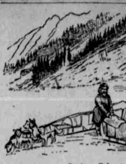
Hunde - Gespann am Yukon-Strom.

ein, an ihren Gatten gerichtete Briefchen in einem Taschenbuch um den Hals. Dann sagte sie zu ihm, gerade als ob er ein Menschenwesen wäre: „Bob, laufe und finde deinen Herrn!“ Bob verstand. Er trabte in der Dunkelheit davon und war bald außer Sicht. Nach etwas über einer Stunde erreichte er Fairbanks; er sah sich überall um und entdeckte seinen Herrn in einem der Häfen. Natürlich las dieser sofort das Briefchen, beschaffte auf der Stelle ärztliche Hilfe, und die Partie traf noch rechtzeitig ein, um das Leben des Kindes zu retten!