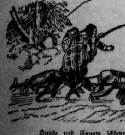
Hunde und Sawas schleppen Boot und tragen Herrn!

Es sind noch manche falsche Vorstellungen über diese Laufschaff-Hunde Nordlands verbreitet. Etliche sprechen von ihnen schlechthin als „Eskimo-Hunde“ und behandeln wenigstens die eingeborenen als eine einzige Rasse. Das ist eine durchaus irrtümliche Annahme. Vielmehr sind hier fast alle Rassen und Größen alid vertreten, obwohl sie sämtlich den Stempel der umgebenden Welt tragen, - nicht minder, als ein geüblich eingelebtes Menschenkind von der vollenrechten Sorte, die man in Alaska „Sawerzig“ nennt. Die kleinen Hunde, wie „Fog Terrier“ sind