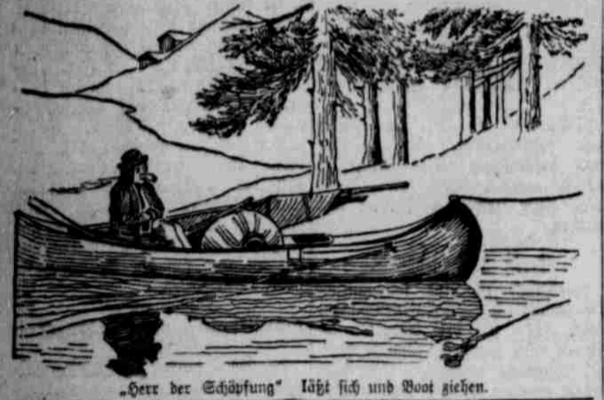
„Herr der Schöpfung“ läßt sich und Boot ziehen.