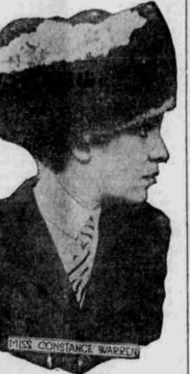
Amerikanerin heiratet einen Grafen