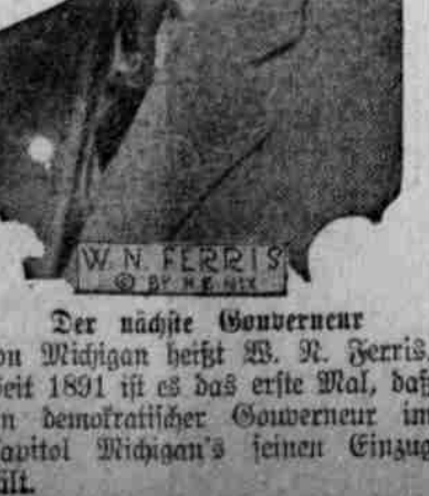
Der nächste Gouverneur

Polizeimeister John B. Steinbart hat den Eltern einen beherrschend-wichtigen Bericht über die Verurteilung gemacht, ihre Kinder zur Sparsamkeit anzuhalten. Das Pflichtgefühl muß in den Kindern geweckt werden. Der Wert des Geldes muß ihnen durch zeitig gegebene Spararbeit beigebracht werden. Dem Kinde sollte irgend eine