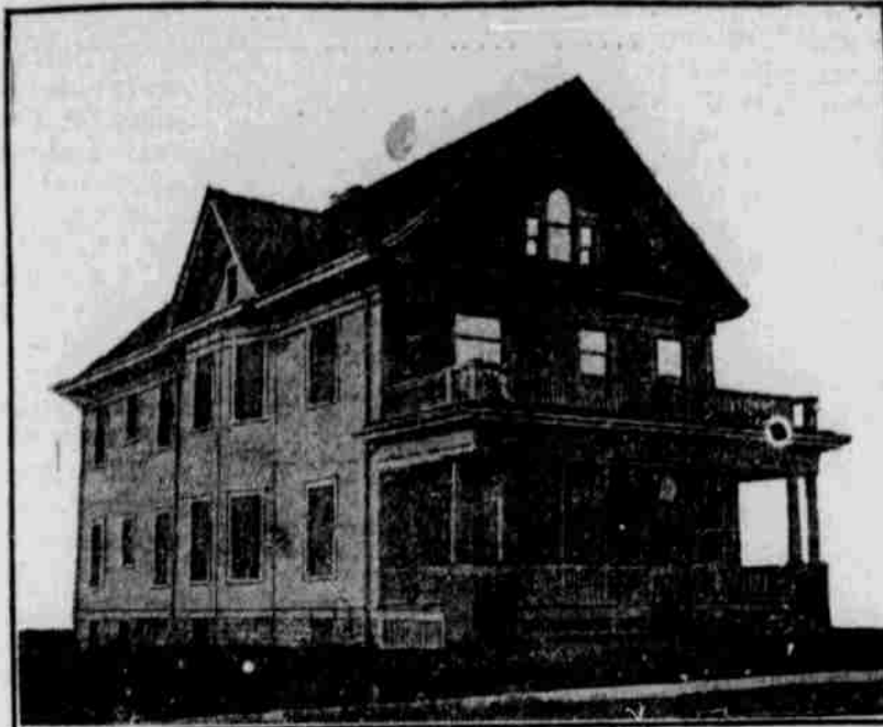
Ansicht aus der Ferne. — Nach einer Photographie.