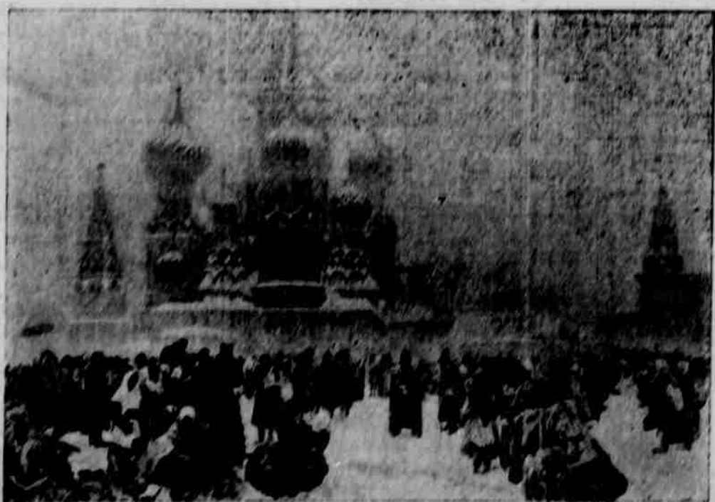
Zrušení roboty na Rusi roku 1861.