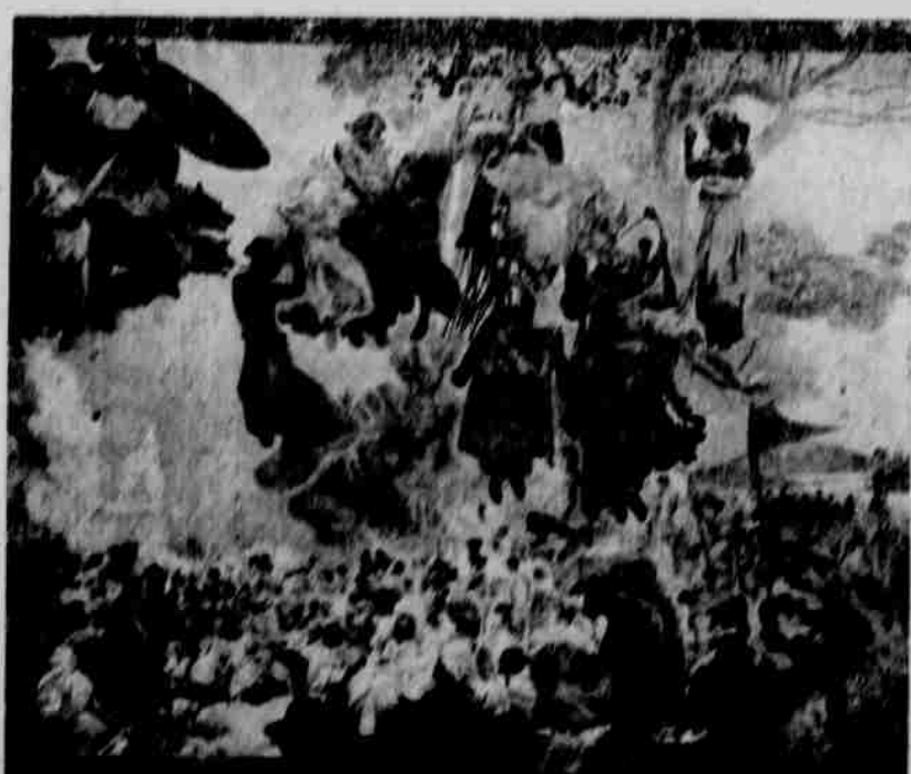
Slavnost Svantovitova na ostrově Rujaně.