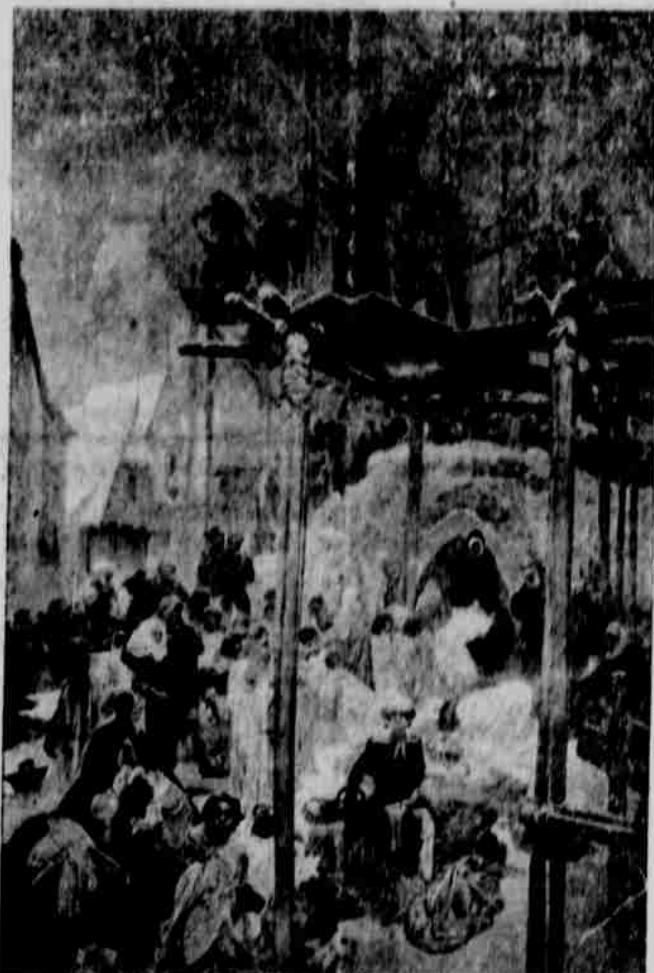
Milič z Kroměříže káže pokání.