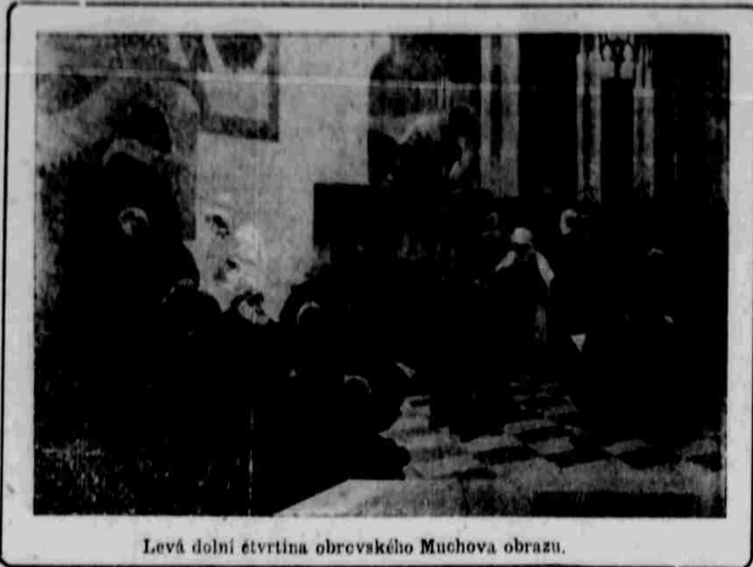
Levá dolní čtvrtina obrovského Muchova obrazu.