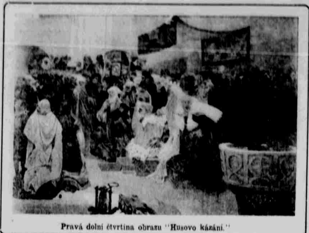
Pravá dolní čtvrtina obrazu "Husovo kázání."