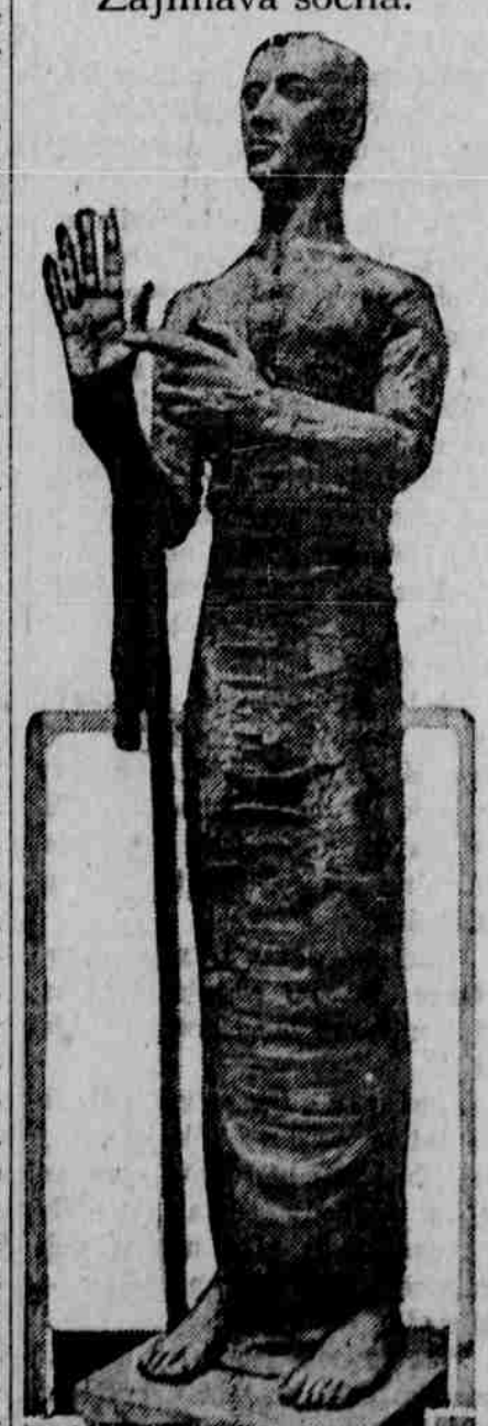
"Z mrtvých vstal Kristus," dlo sochaře Jacoba Epsteina, je nyní vystavováno v Londýně. Je to socha v nadřizovní velikosti a znací umění různé se v náhledech o její hodnotě. Umělecké časopisy londýnské jsou plny zpráv o této zajímavé soše.