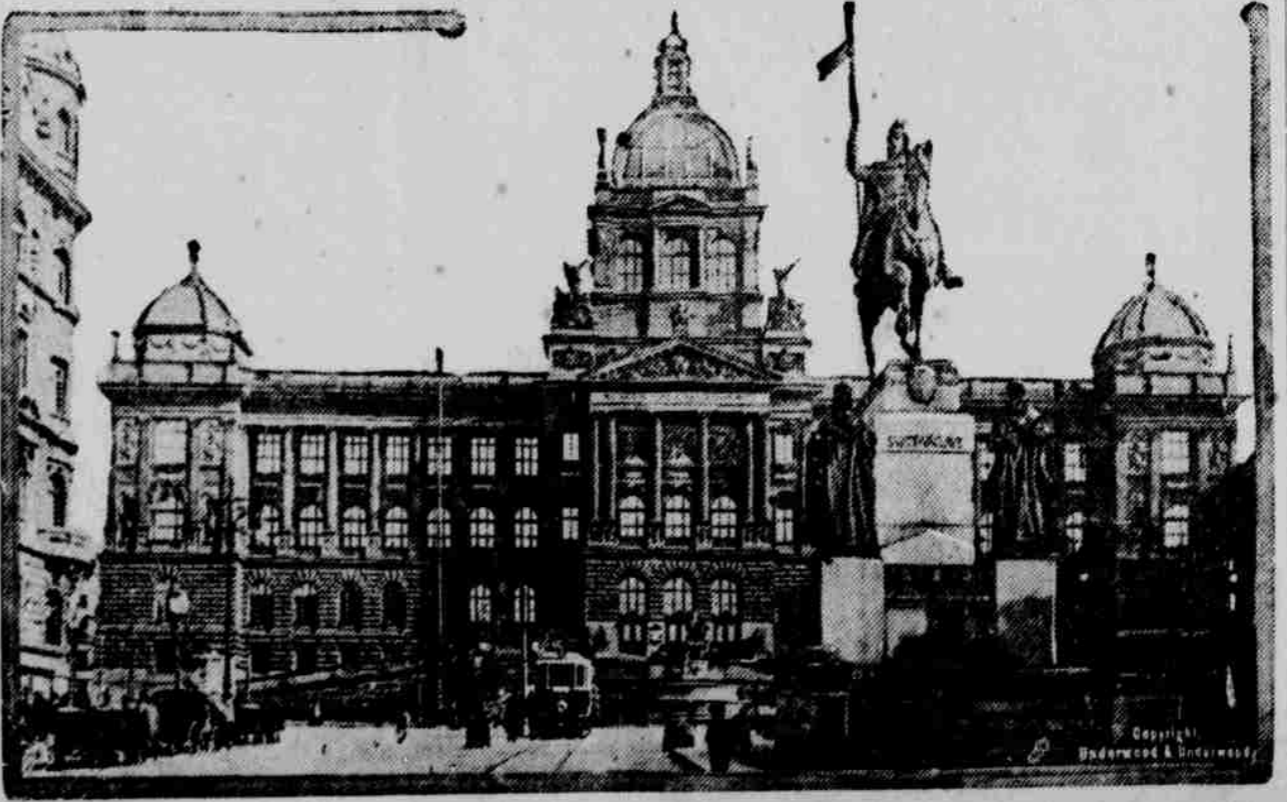
Krásné Československé museum na Václavském náměstí v Praze obsahuje vedle cenných jiných sbírek také velkou sbírku rukopisů vzácné hodnoty. Před musejní budovou spatrujeme sochu sv. Václava, před kterou za války i po osvobození docházelo k důležitým projevům českého lidu.