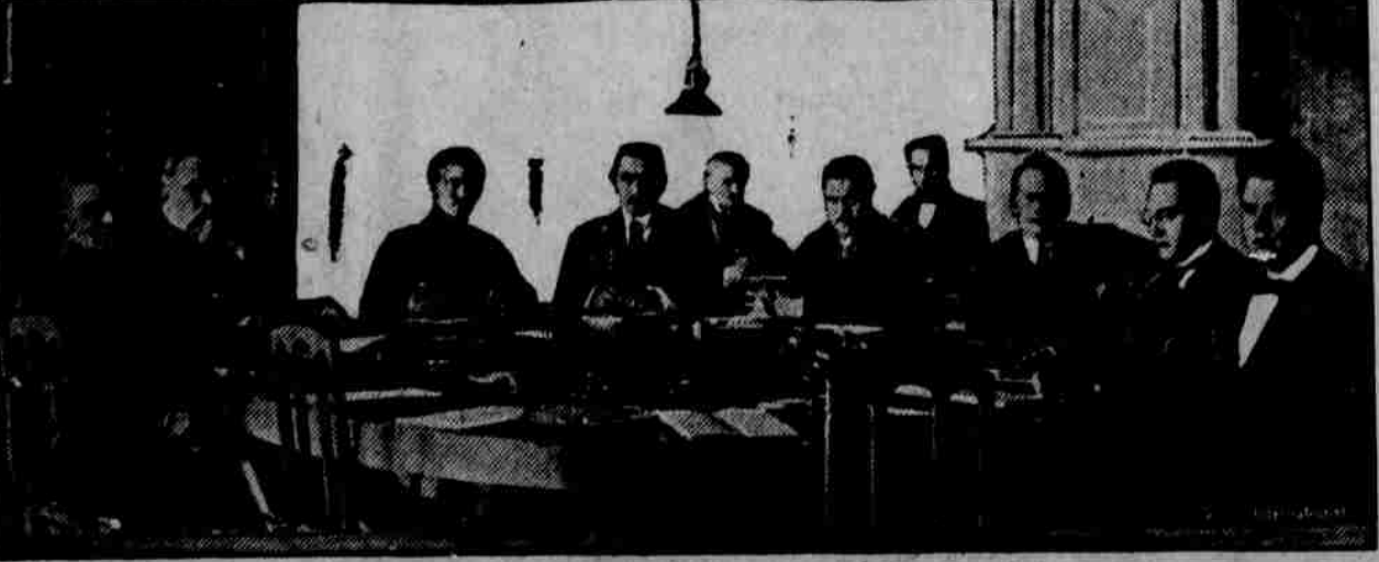
Oznamuje se, že Estonsko se téměř dohodlo s bolševiky na mírových podmínkách. Na obrázku našem spatřujeme delegáty baltických států a sovětského Ruska při konferenci v Dorpatu.