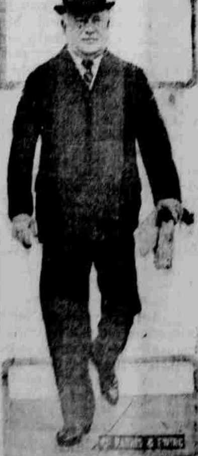
Spolkový senátor Truman H. Newberry z Michiganu, jehož místo v senátu kontestuje Henry Ford z Detroitu.

však jsem se nikdy netačil náhledem, že toto číslo je při nečtením o většinu příliš nízké. Tak bylo ve starém Rumunsku. Veliké Rumunsko ani nevísto počítati a národním jménem asi 80 miliard livr. Poukazují zde pouze na tuto okolnost. Ale Rumunsko je třeba kapitálu mobilního pro vlastní hospodářství. Rumunsko postrádá skoro všech výrobní průmyslových a celé řady předmetů denní spotřeby pro své spotřebitele. To všechno může dodávati československá republika buď přímo nebo aspoň v úloze prostředníků. Dále také domácí průmysl rumunský zvelebiti se může jenom cizím kapitálem, cizím vedením a cizími odbornými pracovníky. I tu jest Československo s to, by vysokou pozveselo rumunský průmysl, ruku v ruce s rumunskými majetníky příslušných surovin, krok za krokem ve společném zájmu.