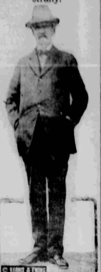
Senátor Albert Baird Cummins z Iowu zvolen byl jednomyšlně všemi hlasy republikánských senátorů za dočasného předsedu spolkového senátu.

šť pod řízením starého režimu. Československé země slymly od mnoha let bohatým průmyslem, které bylo československé domovním dům takofitka do výjiku. Jenom že české zemědělství, ač tolik vyspělé, československým potřebám přece nedostačí. Nezbývá tedy než na tomto poli dovozu. Proč do vážení z jiné strany, když může tak učiniti ze státu spřáteleného, který plodí polní a jinych bude mít zase co nejdivně nadobytéjnou hojnost, jakou mívá před světovou válkou?