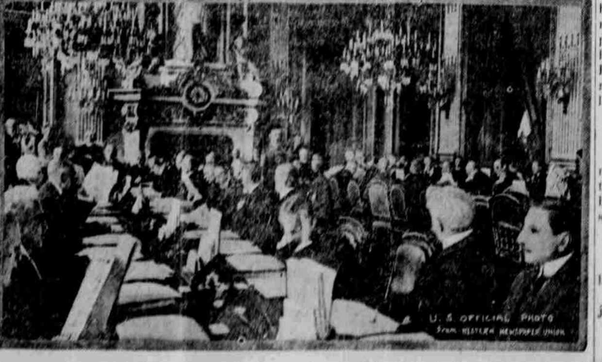
Zde je první fotografie, ukazující mírové delegáty v zasedání v Paříži, jež došla do této země. Delegáti tuto zastupují země, jež byly sdruženy ve válce proti Německu.