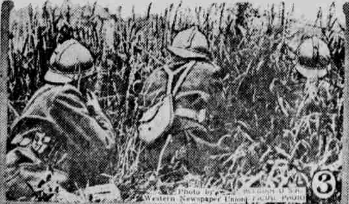
1.—Pozoruhodná fotografie míny, vybuchnuší pod železničním mostem, v části fronty, udržované Američany. 2.—Skupina obyvatel z Ecourt—St. Quentin, shromážděných v Arrasu, po svém vysvobození z německého jáma. 3.—Belgičtí vojáci, plazící se k německým liniím.

jatých a 23,000 zanechaných v nemocnicích. Dne 19. října o poledních spojení vítězně vstoupili do města.