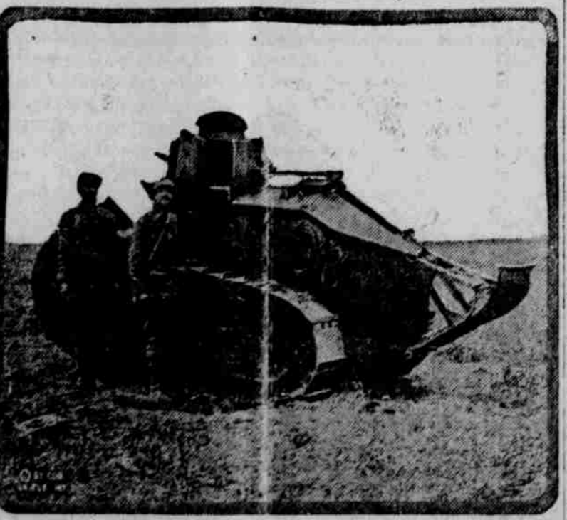
Jedna z menších anglických voznic, kterých s velkou výhodou používá se k odstraňování kulometných střelen nepřítelů, kterými Němci snaží se krýti svůj ústup v severní Francii.