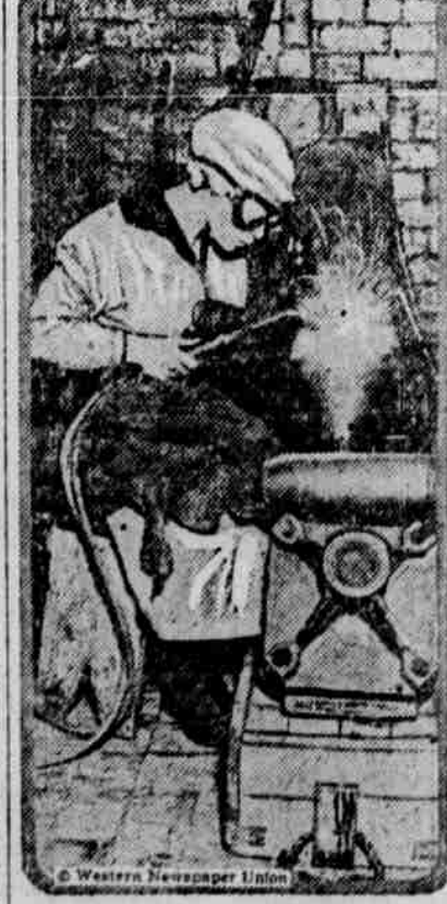
Zatím co jejich bratři a milenci bojují na frontě ve Francii anglické ženy snaží se uspišiti vítězství plnou prací v továrnách, kde střelivo a válečné zbraně jsou hotoveny. Na obrázku našem spatrujeme jednu z těchto anglických dívek, pracujících na vzduchové bombě.

ku, jimiž prošla Evropa za t. zv. stěhování národů. Tehdy šlo vskutku o nové základy pro celý evropský svět; veliká říše římská zanikla a po jejích troskách valily se davy severních barbarů, kmenů germánských a slovanských. Všecko bylo až do nejspodnějších hlubin zpravečeno, nejskvělejší sídla kultury obrácena v sutiny. Jenže byla to spíše tažení národů, hledajících si nové vyhlídky, a po případě i loupeživé výpravy, nežli politicky cílevědomé války dle našich pojmů.