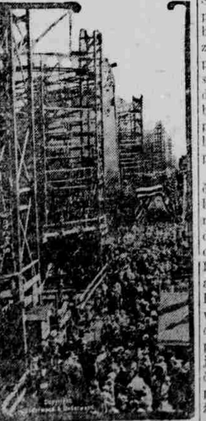
Výjev z loďnice v Newarku při spuštění na vodu lodí Alamo, Aleona a Chetopa.

ky na stanici a bolševici byli nuceni ustoupiti. Česchoslovenští pak vyčkal posil a spolu s nimi dobyli města. Vyšlo na jevo, že bolševici byli proti Čechům a Slováckům poštvaní Němci a proto Češi po krátkém soudu několik Němců se zbrani v ruce dopadených, pro výstrahu ostatních pověšili.