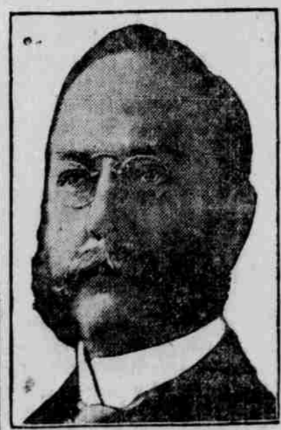
Sekretář obchodu, Redfield.

Bude jej to státi jenom 25 centů na vstupném a 35 centů za příruč-