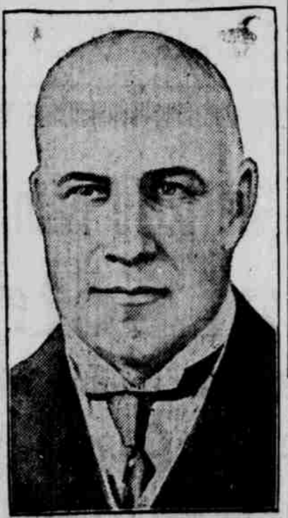
Sekretář vnitra, Lane.

Washington zvolen byl prvním prezidentem nové republiky Spo-