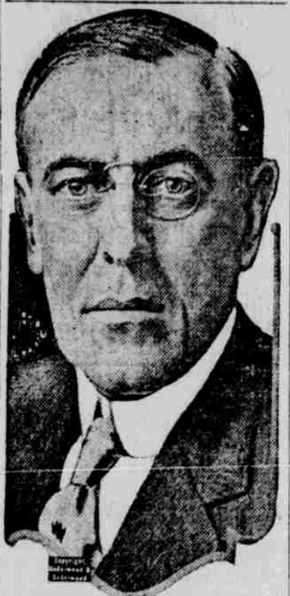
PRESIDENT WOODROW WILSON

všechno to, co Amerika chce a o co pracovala po desetiletí, máme v malíčku a jakékoli další poučení pro nás v těch věcech je čirou zbytečností. Kdybychom vycházeli z takového předpokladu, klamali bychom sami sebe a klamali bychom jiné, neboť takové prohlášení bylo by s pravdou na štíru. Je v nás, Čechích, snad větší pochopení pro americké ideály než u národů jiných, poněvadž jsme odkloneni na lásce ku svobodě a spravedlnosti a milujeme velký ideál pro útisk, který jsme zakusili, nieméně v mnohých případech musíme se ještě učít mnohé chápat a dle toho posuzovat a po případech dle toho se řídit.