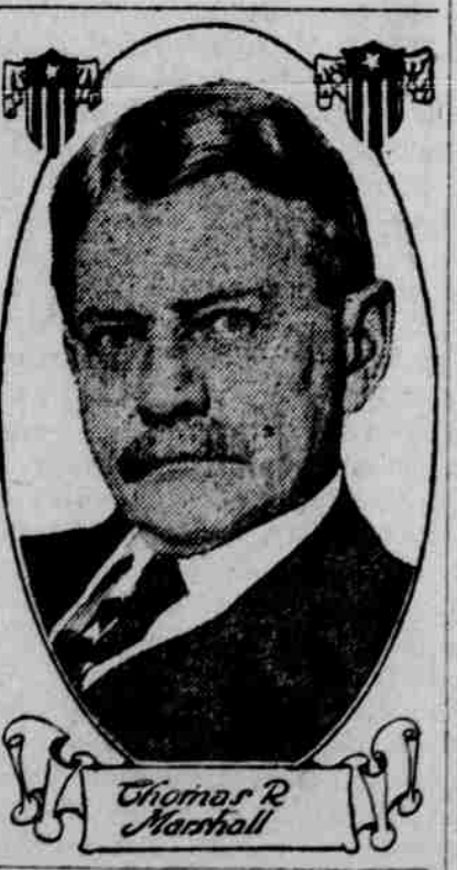
Thomas R. Marshall

Je-li úkolem amerikanisace především přiměti přistěhovalce, by stali se americkými občany a takovými se stavě, pracovali pro rozkvět země, okresu, města, osady a koutku, v němž žijí, kdo může v tom spatrovati pro nás eizokoliv neprospěšného? Žádá-li se, a bychom poznali soustavu správy této země, její historii, její ideály, její způsoby a její zvyky, nekvne nám z toho jenom prospěch? Máme-li přiučiti se anglickému jazyku, abychom tyto ideály lépe chápali, se způsoby a zvyky amerického života se lépe seznámili a lépe byli schopni vykonávati důležitě povinnosti občanů jako spolupodílníků na správě země, státu, okresu a obce, žádá se něco, co prospíváto by jiným a nikoli nám samotným? Je přece jenom na bídě, že všechno to potřebujeme jen k svému vlastnímu prospěchu, aby snadněji se nám žilo, bychom byli šťastnější a sebestačnějšími.