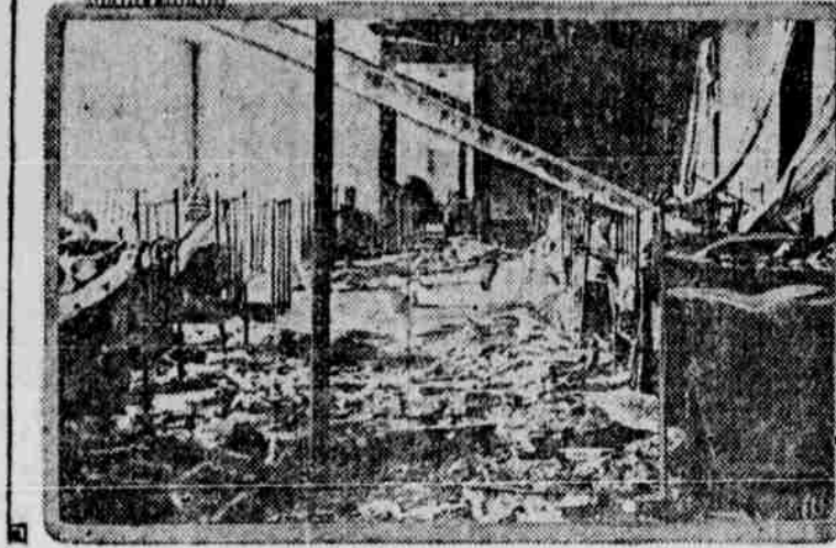
Horejší obrázek ukazuje skupinu domů, které zničeny byly bombami německých letců. Tato místa "vojenské důležitosti," jak oznámili Němci, byla obydlími chudých dělníků. Dolejší obrázek pak ukazuje dormitář dětské nemocnice, který na štěstí byl vyklizen a žádné z dítek nebylo poraněno. V dormitáři nalézalo se 200 dítek, které přestěhovány byly do bezpečí. Nebýti toho, množství jich bylo by jistě usareno anebo poraněno.