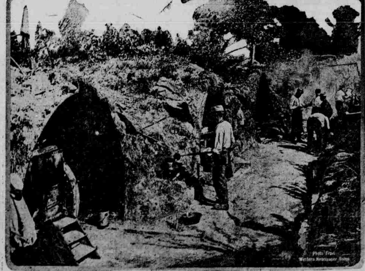
Tisíce podobných pekáren zřízeno bylo francouzským komisariátem nedaleko různých bitevních front. Francouzské metody ve vyživování armád jsou nepřekonatelnými.

Christian s ostatními čtyřadvacíti spiklenci, kteří zůstali na korábu, vrátil se k Společenským ostrovům a šestnáct mužů rozhodlo se, že zůstanou na Otahaiti, kdežto Christian se zbytkem mužstva přijal k sobě sedm mužů a dvanačet žen otahaitských, a odplul na zdarbůh do neznámých konců.