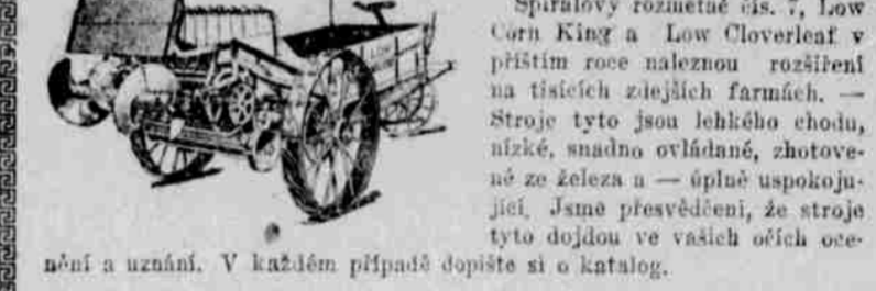
Spiralový rozmetač čís. 7, Low Corn King a Low Cloverleaf v přístupu roce naleznou rozšíření na tisících zeleňích farmách. — Stroje tyto jsou lehkého chodu, nízké, snadno ovládané, zhotovené ze železa — úplně uspokojivé. Jsme přesvědčeni, že stroje tyto dojdou ve vašich očích o poznání a uznání...