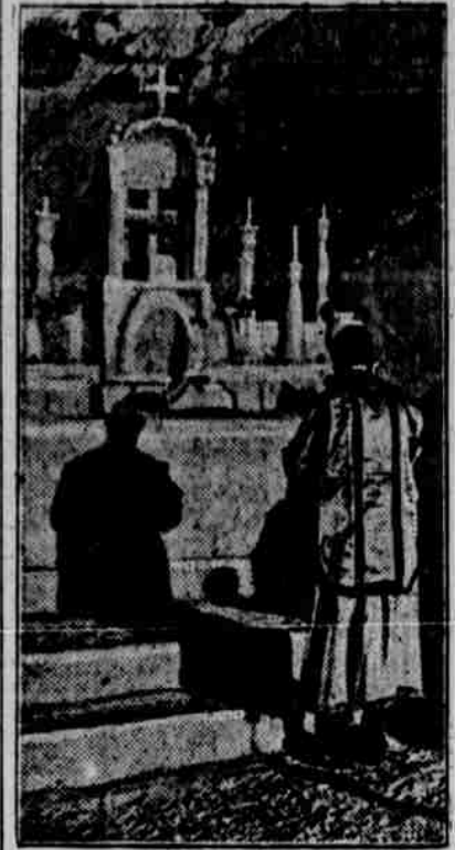
Italští vojáci na Krasu zřídili si nedalekobitevní linie oltář ze sněhu a ledu a na obrázku našem spatřujeme kněze, sloužícího před tímto zvláštním oltářem mši.

nectví, s tím výsledkem, že nedbalé vyšetřování bylo zavedeno. Po dvou měsících starý režim pořel, že drží Durasa ve vazbě, ale popětí měsících dovolil starý režim druhému sekretáři petrohradského amerického velvyslanectví, Armouroví, aby jej navštívil v hlavním vězení. Po triumfu revoluce byl Duras propuštěn a dostal se do Kijeva, kde byl poznovu vzat do vazby. Tou dobou Durasův pas zmizel, a následkem toho neměl žádného statutu, byl opět uvězněn v Petrohradě, ale propašoval zprávu velvyslanectví, a případem byl pověřen první sekretář velvyslanectví Bailey, před třemi měsíci. Neobjevily se však žádné výsledky buď v získání soudu propuštění.