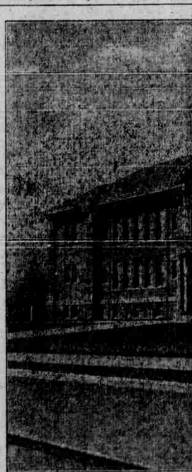
Škola Edwarda Rosewatera v tak zvaném Brně.

Prvním pokusem k utužení společenského života bylo založení Čtenářského spolku, v roce 1871. Spolek tento však následkem rozháraných poměrů tehdejších neměl dlouhého trvání, na hrobě jeho však v brzkou vzešla nová ratolest, čtenářsko-podporující spolek, založený 26. ledna, 1873. Rokem 1877 počal se společenský a spol-