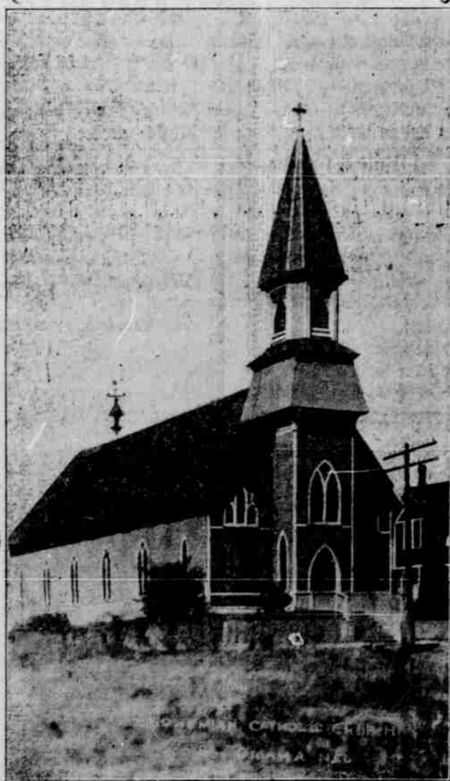
Český chrám Nanebevzetí Panny Marie v South Omaze.

Více jak 500 osob, konajících vojenskou výpomocnou službu, jest zaměstnáno zapisováním z bojště zasláných předmětů. Po dojití jednotlivých zásilek váhá vláda po nějakou dobu oznámiti smrt příslušné rodině, an se za časté stávalo, že se přihodil osudný omyl. Kolikráte se již přiho